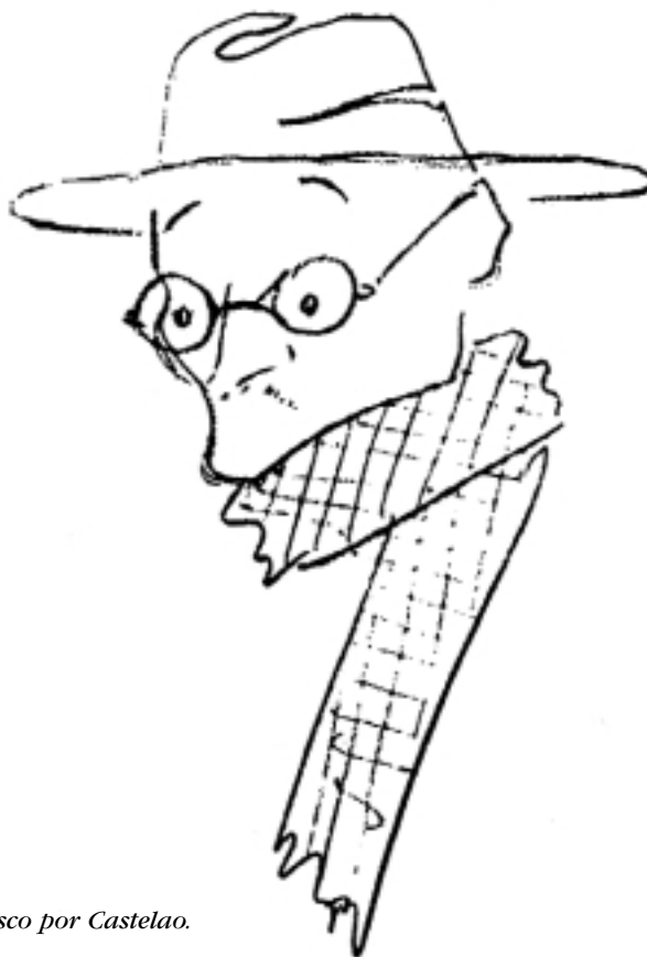
Risco por Castelao.

Desde abril de 1931, sectores minoritarios da Igrexa galega, perante a inminente definición da República como Estado laico, intenta, con Otero