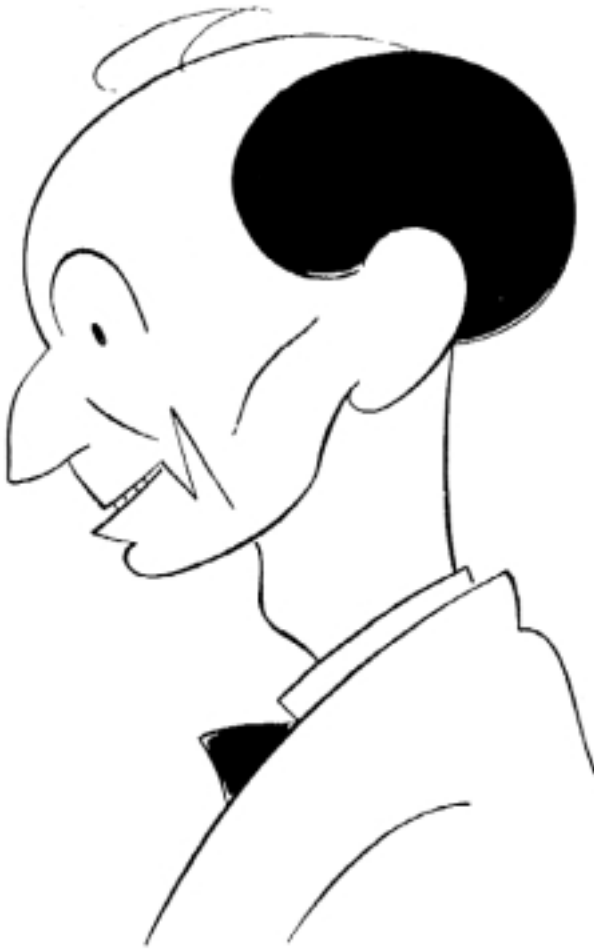
Casares Quiroga caricaturizado por Castelao.

lealmente ó servizo dos dous obxectivos maiores que tiña daquela todo o nacionalismo galego, fose democrático ou tradicionalista: a reunificación e reorganización do movemento como forza política independente, e a consecución do máximo nivel posible de autogoberno e de reconstrucción cultural e nacional para Galicia.