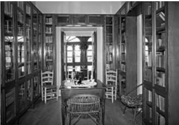
Renxe a saa co meu andar ( Bocarribeira ).

miragre de vivir no fío esencial do decorrer do esprito, en chea soberanía pola Liberdade.” 8