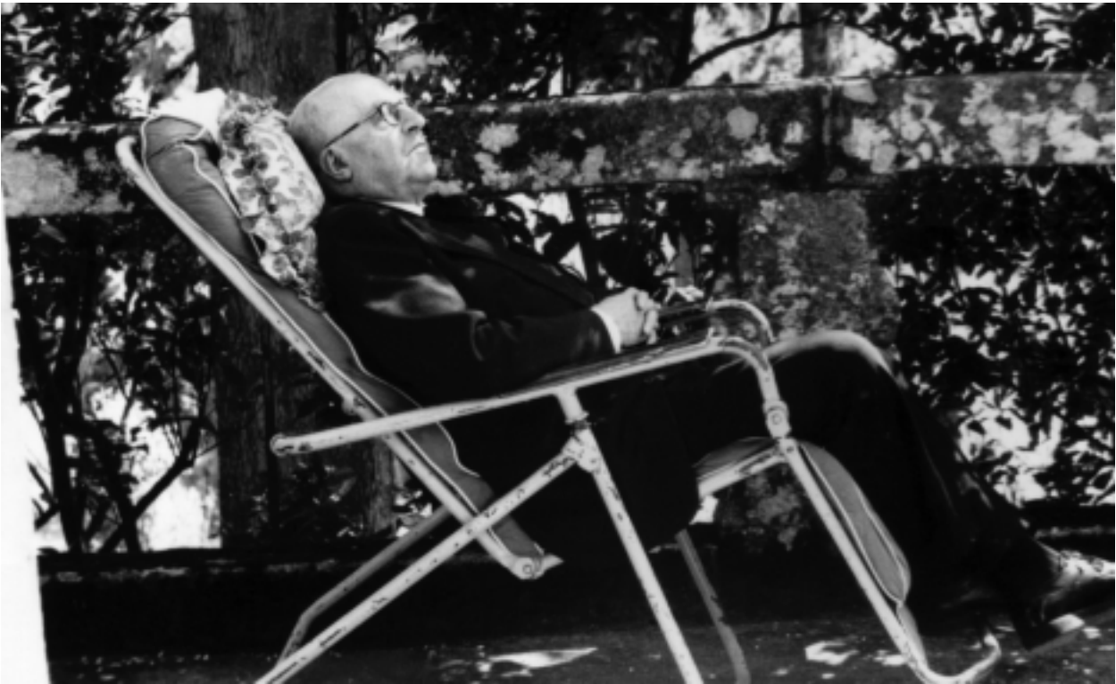
Otero na solaina da Casa Grande de Cima de Vila. Trasalba: verde lús nas pupilas de pedra (Bocarribeira).

“Enemigo dos estudos críticos por temperamento e por falla de preparación, dígovos (...) que (...) non hai outro camiño, para vós, mocíños novos, que o de enfrentarse, sin intérpretes nin prologuistas, coa enorme obra do Patriarca. Tampouco vos fallarán estudos críticos. Fuxide de eles. E pensai sinceramente, pola vosa conta, sobor de Werther, (...)” 2