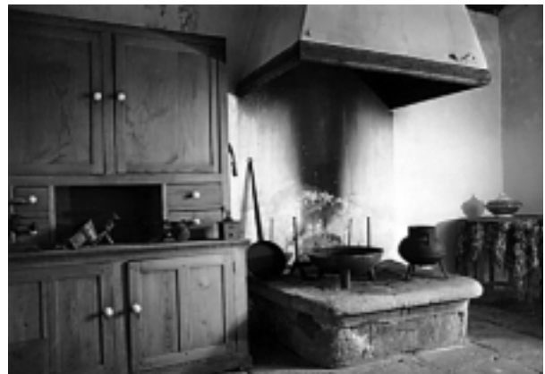
O vento (...) salfrú a cinza do lar ( Bocarrifeira ).

Quizais haxa quen dubide da pertinencia do título que puxemos a este escrito noso; nós defendémola, e confesamos que verbo de tal epígrafe quixeramos que este fose abondo suxestivo como pra ficar na lembranza e na atención das rúas do espírito 57 . Sabido é, por outra parte, que a pluma do noso escritor deita solainas orceladas aquí e acolá; xa, máis arriba, temos citado un fragmento de Romantismo, saudade (...), no que lemos: “Os granitos barrocos da soláina (...) cobertos de orcelos soñan, quizáis, na súa nudeza, co tempo xeolóxico en que eran pensatiles e ergueitos penedos na liberdade do coto.” 58 Os asiduos da obra oteriana saberán ónde escolmar máis textos para engadir; botamos nós man agora dos seguintes: