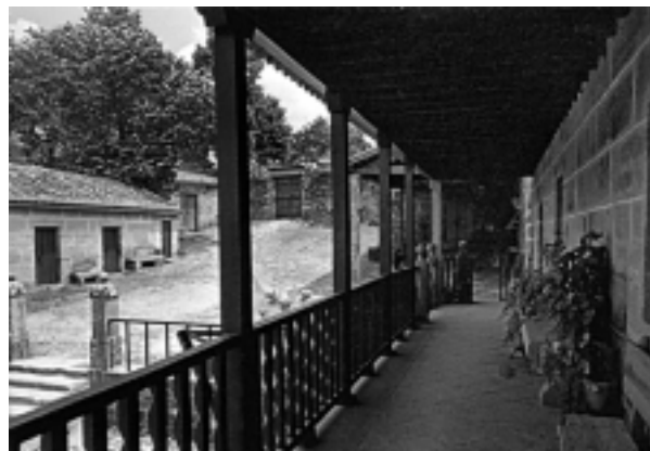
O corredor da Casa Grande de Cima de Vila; alá, ó fondo, o portón: laio do portón, / salouco da cancela... / quen saíu cecais non volte / a entrar por ela (Bocarribeira).

O cerne da nosa cultura tira, pois, o seu vigor da indeleble arela de fusión da terra coa vida do home, da proxección do humano na paisaxe, da imposibilidade