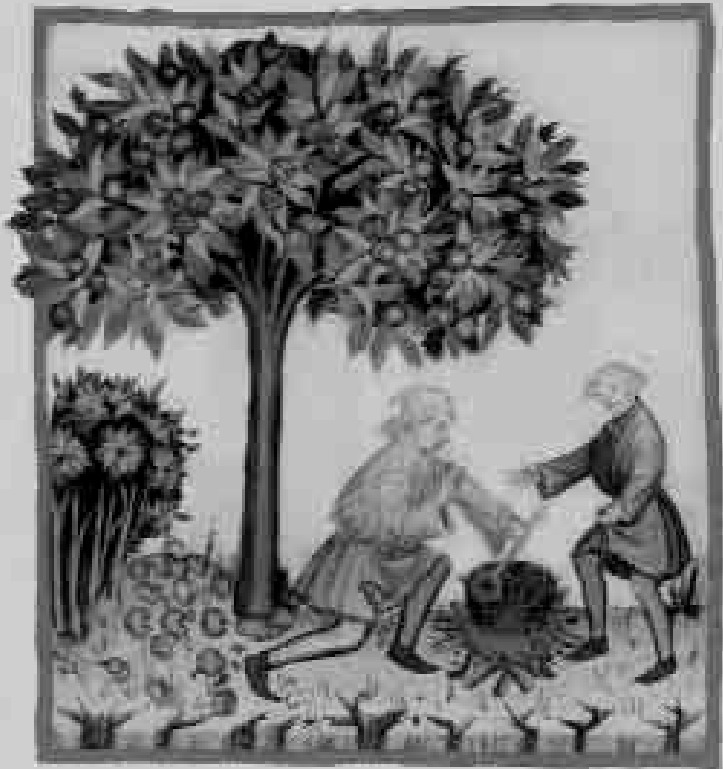
Cacharela medieval. Ilustración do Tacuinum Sanitatis (ss. XIV-XV).

Ocupa, ademais, dentro da "Asociación de Xenealoxía, Heráldica e Nobiliaria de Galicia" a Delegación Territorial da comarca de Caldas.