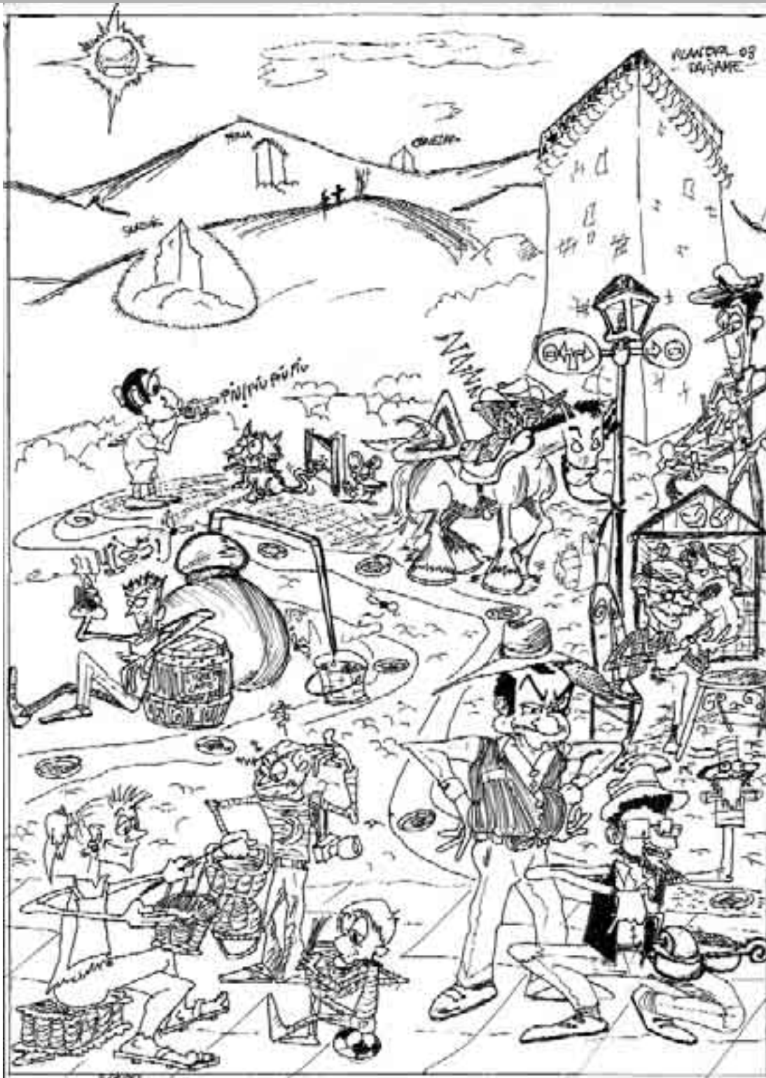
2° PREMIO Concurso Artístico Jesús Vázquez Nieto