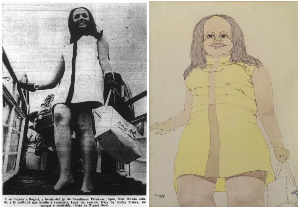
Figura 5. Madeleine Hartog-Bel, Miss Mundo 1967, descende del avión en una breve escala en el aeropuerto El Dorado de Bogotá, febrero de 1968.

promoviendo nuevas encarnaciones generalizadas (y generizadas) de aquello que, ásperamente, la artista repele.