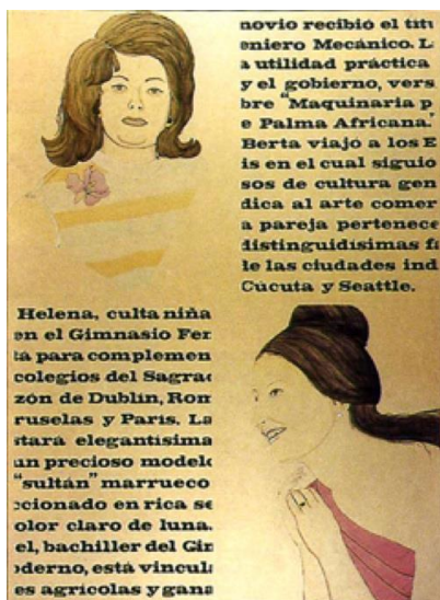
Figura 4. Clemencia Lucena “Matrimonios para el sábado”, 1970 Acuarela sobre papel, 150 x 110 cm.

Si, ya entrados los años setenta, sus obras se entregan a la propaganda triunfalista del movimiento social, en estas propuestas previas, la sátira, el escarnio y la invectiva son estrategias de contra-propaganda y campañas deliberadas con las que pretende demoler, con cierta crueldad, una ideología o enajenación específica que es masivamente suministrada por actos y medios oficiales, ya sean públicos o privados. De modo similar a como embiste en la década siguiente en artículos y ensayos contra el arte abstracto y la pintura (según la artista abiertamente pro-imperialista o con “careta de izquierda”) supone al servicio de los intereses de la burguesía, en la cáustica mirada lanzada sobre estas mujeres, Lucena tiende a fustigar, sin clemencia.