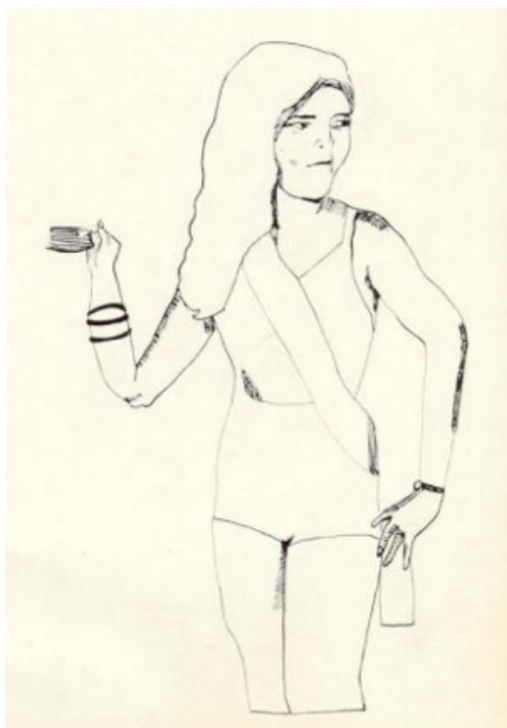
Figura 3. Beatriz González “Leticia León, nueva Venus” (I), 1966 27 x 24 cm.

siguiente (Traba, 1968). Al igual que en sus “novias”, son los textos y fotografías tomados de anuncios y páginas sociales de distintos medios impresos los que suscitan las imágenes y los títulos en sus obras, aunque no necesariamente ambos (texto e imagen) coincidan en la misma publicación.