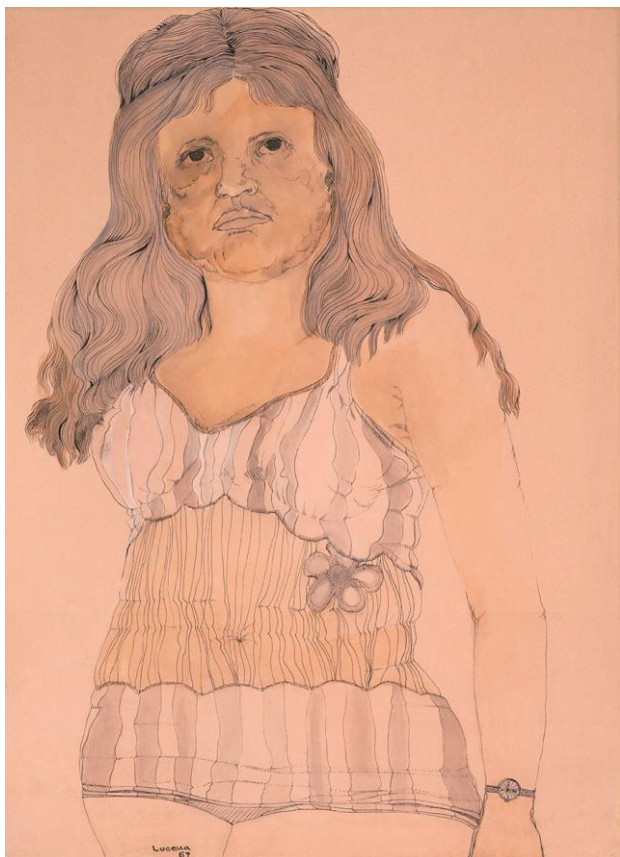
Figura 2. Clemencia Lucena “Mujer con vestido de baño y flor”, 1967. Pintura, 76 x 55 cm.

(...) la escasa representación de ellas en las listas [de aspirantes a cada partido], el endurecimiento del régimen, la falta de reformas sociales, se expresó tanto en las cifras crecientes de abstención electoral femenina durante los 16 años del Frente Nacional (Velásquez, 1999).