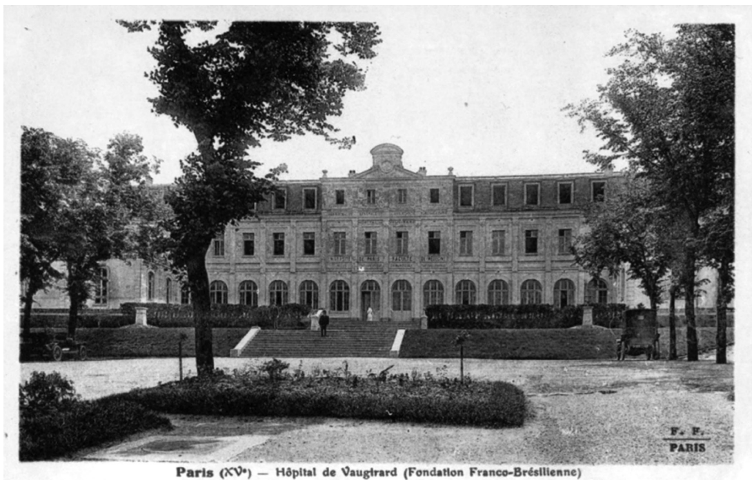
Figura 3 – Hospital de Vaugirard

O edifício logo foi oferecido aos brasileiros, com a contrapartida de que estes cuidassem tanto dos feridos de guerra quanto dos doentes pela Gripe. Esse hospital, além de prestar ajuda à assistência pública francesa, também serviu como uma espécie de quartel-general durante o período de guerra reunindo os missionários brasileiros.