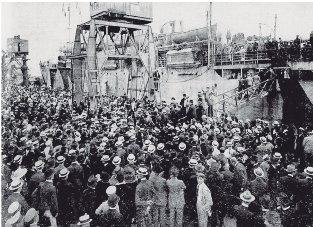
Figura 2 – Aspecto do porto na partida da Missão à França