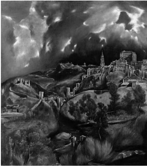
Figura 5 - El Greco. Vista de Toledo sob a tempestade, 1610/14; óleo sobre tela, 121 x109 cm. Museu Metropolitano de Arte, Nova York, EUA

mágica. O artista interpreta a crise espiritual de seu contexto social e político, imprimindo um clima trágico à cena, acentuado pelo céu tempestuoso e, principalmente, pelas deformações verticais da catedral de Toledo, um dos monumentos da arquitetura gótica espanhola.