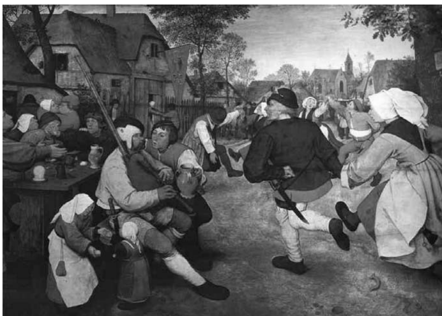
Figura 4 - Pieter Bruegel. Dança camponesa, 1568; óleo sobre tela, 114 x 164 cm. Museu Histórico de Arte de Viena, Áustria

Bruegel “flagra” momentos espontâneos e autênticos do cotidiano, figurando o movimento com naturalidade. A perfeição da representação demonstra o pleno domínio das técnicas formais; como opção individual, utiliza a cor pura (principalmente o vermelho, os tons terrosos e o dourado) como elemento expressivo. Sua obra é uma