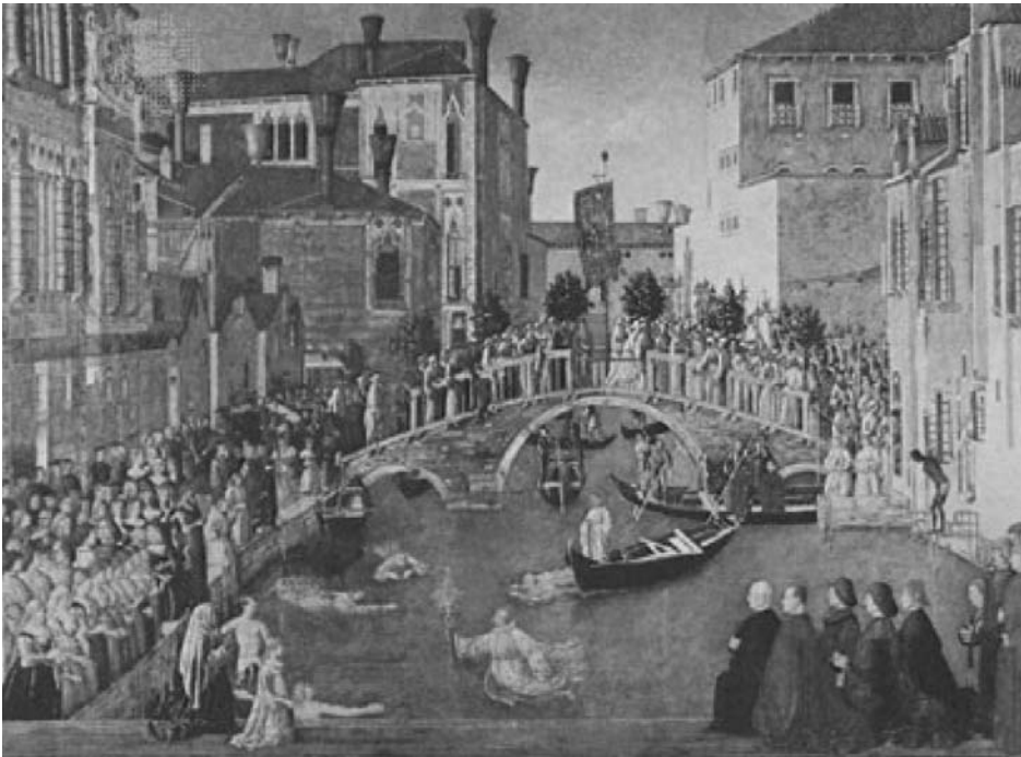
Figura 6 - Canaletto. Bucintoro preparando-se para deixar o porto no dia da Ascensão, 1740. Óleo sobre tela, 122 x 1183 cm. National Gallery, Londres

Gionanni Antonio Canale (1697-1768), mais conhecido como Canaletto, considerado o mais importante pintor de paisagens veneziano, foi um dos que com grande precisão técnica e habilidade registraram a arquitetura e a “luz” da cidade (Fig. 6). Suas obras, ricas na profusão dos detalhes, evocam uma visão romântica e revelam uma arguta observação do espaço físico. Formado na tradição da cenografia teatral, o artista interpretou a paisagem