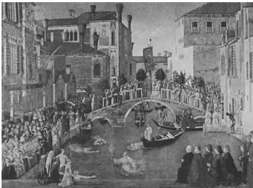
Figura 3 - Gentile Bellini. O milagre da cruz verdadeira perto da ponte de San Lorenzo, 1500. Óleo sobre tela, 323 x 430 cm; Galleria dell'Academia, Veneza, Itália

Os cidadãos renascentistas tinham muito orgulho de suas cidades e do novo modo de vida e buscavam registrar essa realidade mediante a representação pictórica dos eventos sociais, políticos e religiosos especiais. Esse fato estabeleceu um novo mercado a ser explorado pelo artista; assim, muitos foram os que utilizaram a cidade e seus eventos como pretexto para mostrar a vida cotidiana urbana. Gentile Bellini (1429-1507) foi um dos mestres re-