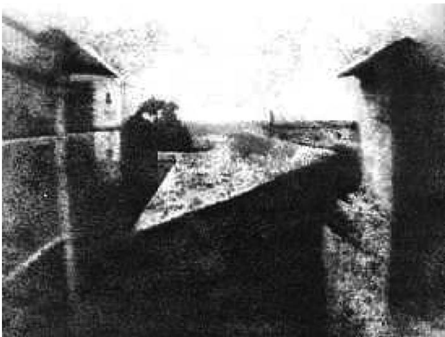
Figura 8 - Joseph Nicéphore Niépce. Primeira fotografia, 1826, Le Gras em Chalons-sur-Saône, França.