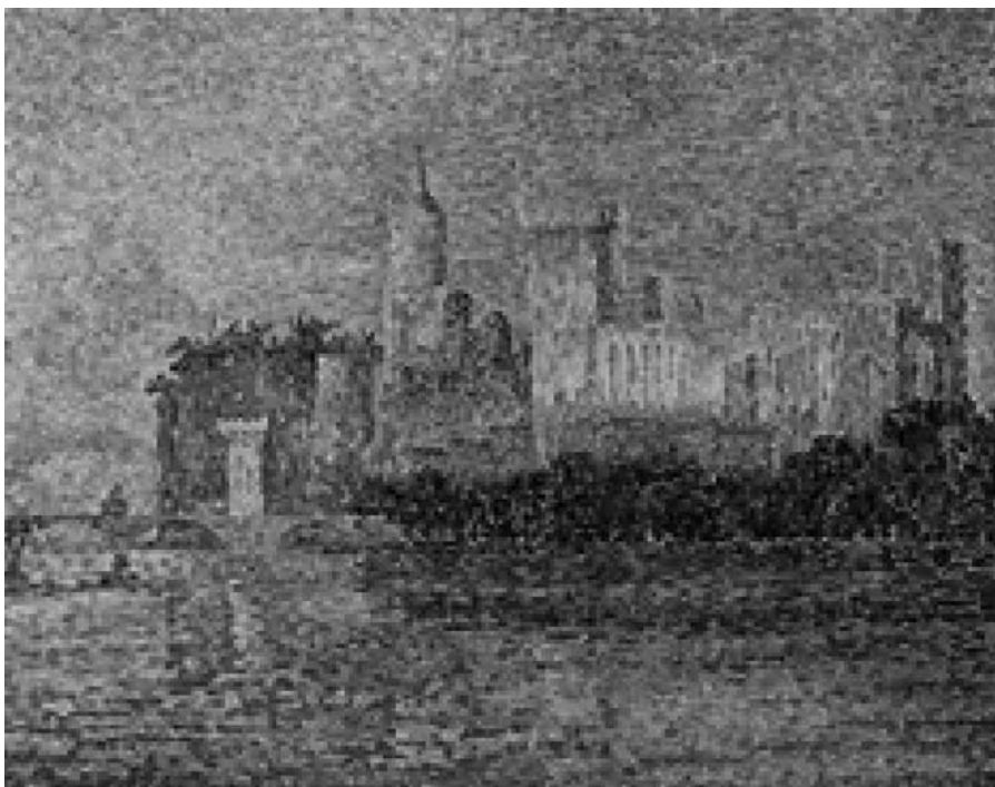
Figura 7 - Paul Signac. O palácio papal, Avignon, 1900; óleo sobre tela, 73,5 x 92,5 cm. Museu D'Orsay, Paris, França

dentro dos padrões da perspectiva linear; resulta do esmagamento dos volumes e transforma o tridimensional em bidimensional. O caráter técnico e a gênese automática garantiram à fotografia (em seu surgimento) o status de “espelho do real”: uma imagem analógica – mimética por natureza – que recorta do mundo um pedaço do espaço. 22