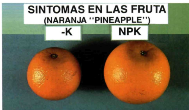
Tomado del Folleto "Potasa su Necesidad y Uso en la Agricultura"

Transformación de unidades: El K^+ puede expresarse en las siguientes unidades que son equivalentes numéricamente entre si: