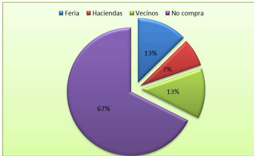
Figura 2. Procedencia de animales de reemplazo en la comunidad estudiada.