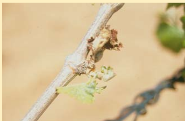
Figura 1. Helada en brote de vid.

Actualmente consideramos a la sociedad española como una sociedad moderna y avanzada que progresa hacia cotas de desarrollo insospechadas, sobre todo si la comparamos con la de hace unas décadas. Como consecuencia de lo anterior, un signo inequívoco de dicho avance lo encontramos en la capacidad de dotarse de unos sistemas de protección y garantía que logran reducir el riesgo en el desempeño de las distintas actividades productivas. Por tanto, el sector agrario no puede arrinconarse en posturas primitivas de evasión de dicha realidad, máxime cuando además existe un amplio consenso, entre las diferentes instituciones y personas comprometidas con este sector, en considerar los seguros agrarios como un importante mecanismo de seguridad, cuya preservación y buen funcionamiento constituye una garantía de seguridad imprescindible, no sólo para los propios agricultores, sino para el resto de la sociedad (López de Coca, 1997). Dentro de las principales investigaciones que se han desarrollado sobre este tema, nos encontramos con Trivelli et al. (2004), Morduch (1990) en sus trabajos sobre América, de Dercon (1998) en sus análisis sobre África y Fafchamps y Pender (1997) sobre la India, donde analizan como el agricultor tradicional, debido a su limitada capacidad para afrontar disminuciones en la renta de sus explotaciones como consecuencias de catástrofes, fundamentalmente climáticas (Figura 1) optan por una agricultura menos arriesgada y también menos rentable.