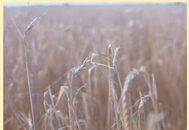
Figura 2. Siniestro de pedrisco sobre cebada.

Además, mediante el Seguro Agrario se favorece la creación de riqueza en general al evitar que los productores deban emplear recursos económicos en aminorar sus riesgos, al poder conseguirlo mediante el seguro a un coste menor, por la capacidad del sistema de compensar las pérdidas entre riesgos, zonas y agricultores.