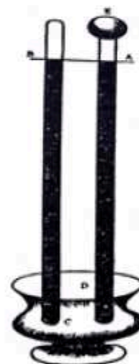
Representação dos tubos utilizados pelo senhor Torricelli

Torricelli: A água em um tubo similar, embora mais longo, subirá até cerca de 18 cúbitos, isto é, [sobe] tanto mais do que aquilo que o mercúrio sobe, o quanto ele é mais pesado do que a água; de forma a haver um equilíbrio com a mesma causa que atua sobre um e sobre o outro. Este argumento é reforçado por um experimento feito simultaneamente com o tubo A e com o tubo B, no qual o mercúrio sempre permanece na mesma linha horizontal AB. Isso deixa quase que certo que a ação não se origina de dentro; por que o vaso AE, onde haveria mais substância rarefeita, deveria ter exercido uma força maior, atraindo muito mais ativamente, por causa da maior rarefação, do que se observa no espaço menor B. Tenho me empenhado em explicar por esse princípio todos os tipos de repugnâncias que são sentidas em vários efeitos atribuídos ao vácuo, e ainda não encontrei alguma com a qual não consiga lidar com sucesso. [...] parece-me tolice tentar atribuir ao vácuo aquelas operações que se seguem evidentemente de alguma outra causa.