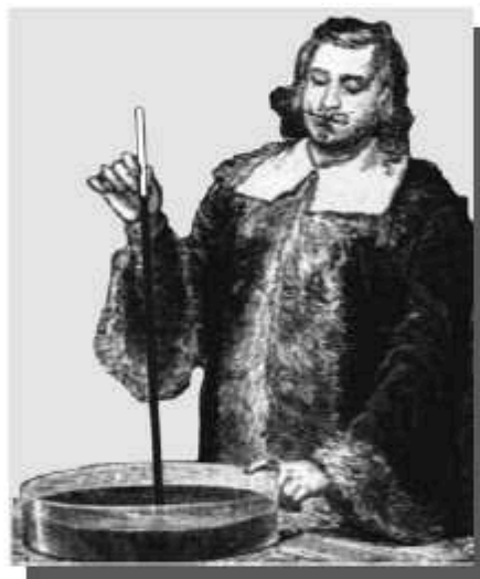
O Senhor Evangelista Torricelli

experimentos filosóficos, não sei exatamente o que, relacionados ao vácuo, elaborados não simplesmente para produzir vácuo, mas para chegar a um instrumento que nos mostrará as mudanças na atmosfera, se está agora mais pesada e densa e depois mais leve e sutil.