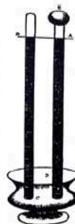
Representação dos tubos utilizados pelo senhor Torricelli

sempre cheio até a altura de um cúbito e um quarto e uma polegada. Para mostrar que o tubo estava completamente vazio, enchemos a bacia com água pura até D e então, erguendo o tubo pouco a pouco, vimos que, quando a abertura do tubo alcançou a água, o mercúrio caiu do tubo e a água subiu com grande violência até