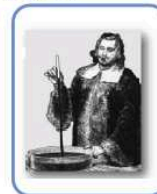
Figura 5: Evangelista Torricelli

Em um recipiente usado em experiências de laboratório, ou mesmo dentro de uma ampla sala, o peso do ar tem pouca influência na pressão por ele exercida. [...] se dividirmos o peso do ar de uma sala (768 N) pela área do piso ( 24 \text{ m}^2 ), teremos uma pressão de apenas 32 Pa. Esse valor é insignificante quando comparado aos 10^5 \text{ Pa} da atmosfera terrestre. Por outro lado, a atmosfera terrestre é um “recipiente” tão alto (cerca de 500 km de altura) que a contribuição gravitacional à pressão torna-se extremamente importante. Se desenharmos no chão, no nível do mar, um quadrado de 10 cm de lado, a “coluna de ar” acima dele terá massa de 100 kg. A massa total da atmosfera terrestre é aproximadamente 5.300 trilhões de toneladas, ou seja, não é nada desprezível. Devido à distribuição não uniforme do ar atmosférico, a pressão atmosférica diminui à medida que nos afastamos da superfície da terra, conforme representado na figura abaixo que representa a variação da pressão atmosférica com a altitude.