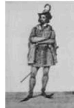
Figura 2: Jean Buridan

Que fenômeno Buridan estava tentando explicar?