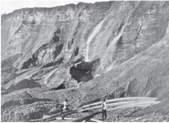
Foto n° 2: Mineros de oro excavando acantilado erosionado con chorros de agua (en una mina de placer-Dutch Flat_California-1857_1870).

Con frecuencia las empresas mineras padecen severas condiciones —cuando no restricciones— para operar, invocando para ello las autoridades razones ambientales. Aunque es de todos conocido el actual escenario de crisis ambiental global, por aquello de la incompatibilidad de la finitud de los recursos naturales con la insaciable necesidad del actual sistema económico de crecer indefinidamente, resulta frecuente encontrarse con condiciones y prescripciones administrativas que no son las más adecuadas a la situación planteada, motivado en ocasiones por el papel mal entendido de las partes, que requiere avanzar hacia un cambio de paradigma que necesariamente ha de basarse en un firme compromiso de responsabilidad social. Pero este desafío no es posible sin una firme voluntad de las administraciones públicas de cambio de actitud hacia los administrados, de tal forma que las empresas dejen de ser vistas como el enemigo a batir. El desafío pasa necesariamente por una firme alianza entre empresas y administraciones, de tal forma que los