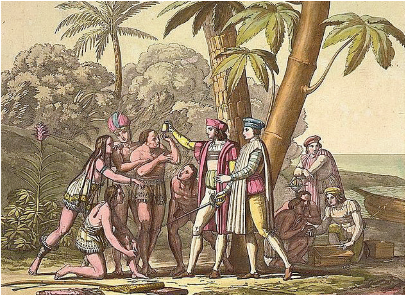
Foto nº 1: Cristóbal Colón muestra objetos a los hombres y mujeres nativos americanos en la costa.

Cuando los españoles descubrimos el Nuevo Mundo hace cinco siglos encontramos allí a unos nativos que andaban en taparrabos, cuando nosotros construíamos un imperio y presumíamos de bachilleres y de universidades. Actualmente, en Estados Unidos de América se encuentran las mejores universidades del mundo y son ellos los que nos colonizan a nosotros. ¿Qué ha ocurrido para que en ese relativamente corto espacio de tiempo se haya invertido tan drásticamente la posición relativa de ambos países? No es objeto de este artículo analizar tal cuestión, pero sí detenerse a comentar algunos de los aspectos más relevantes de la situación de ambos países, especialmente de aquello que no funciona en España pero que sí funciona en EEUU y en otros países, y de cómo podríamos aprender de ellos.