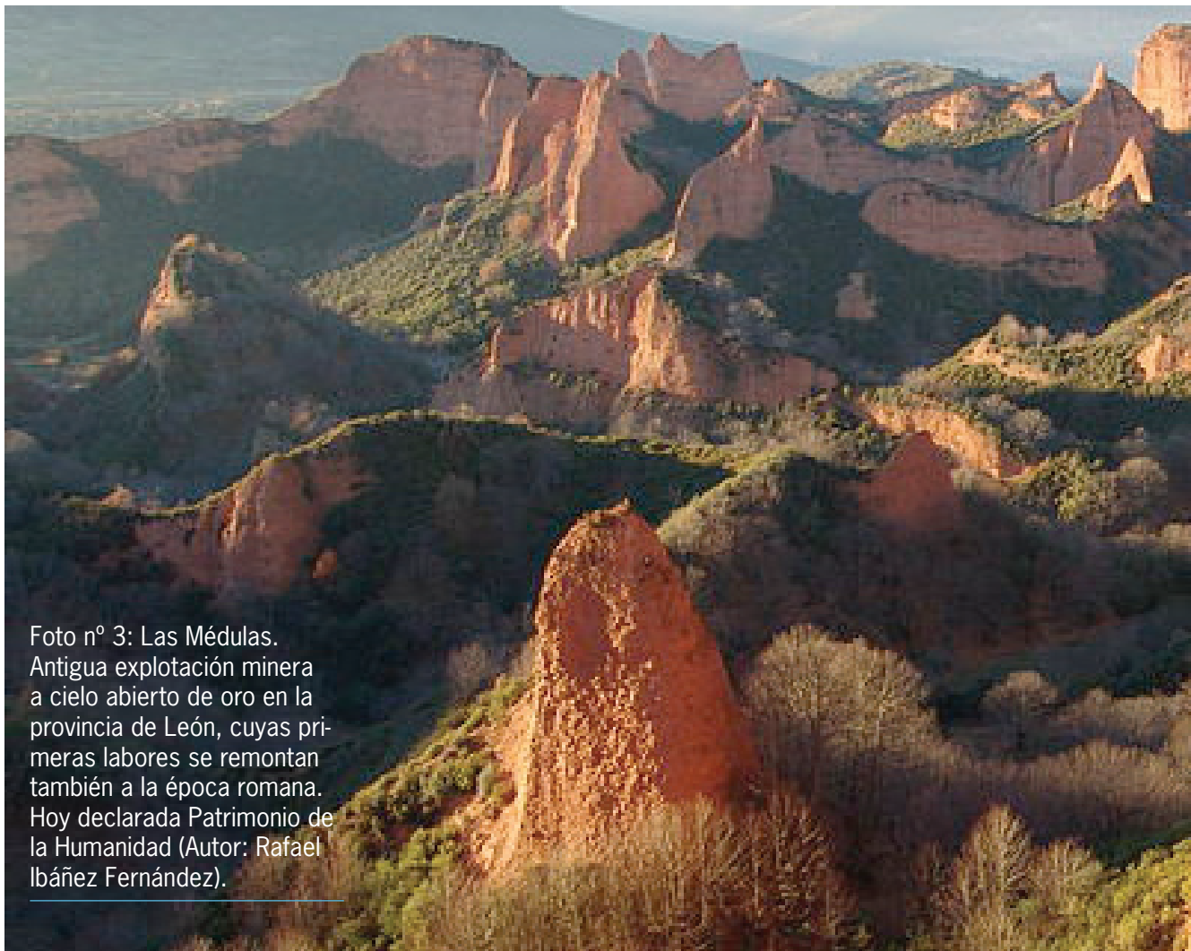
Foto nº 3: Las Médulas. Antigua explotación minera a cielo abierto de oro en la provincia de León, cuyas primeras labores se remontan también a la época romana. Hoy declarada Patrimonio de la Humanidad (Autor: Rafael Ibáñez Fernández).

protección del medio ambiente, y esa demanda y preocupación social ha traído aparejada consigo la legislación ambiental que antes, hasta hace tres décadas, era casi inexistente. Y si no es adecuado juzgar hoy a un sector por algunas posibles malas prácticas del pasado, tampoco lo es cuando, como ocurre con el Fracking , la técnica utilizada ha evolucionado tanto que su estado del arte actual en nada se parece, gracias a las radicales innovaciones implantadas a lo largo de los años, al de sus inicios, cuando se produjeron algunos casos de contaminación de las aguas.