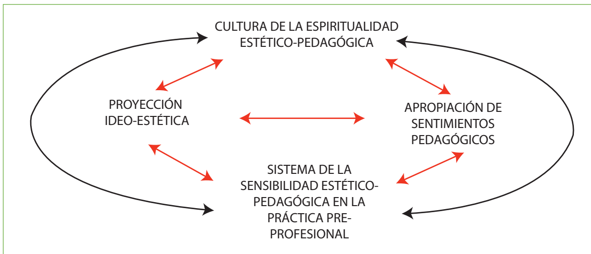
Figura 1. Dimensión: Construcción de la cultura estético-pedagógica

Por otra parte, la sistematización de la sensibilidad estético-pedagógica se desarrolla en la práctica formativa de la subjetividad estético-pedagógica, comprendida como el potencial docente, sustentado en la subjetividad estético-pedagógica. Esta práctica no se logra espontáneamente, se desarrolla a través de un proceso pedagógico condicionado por la orientación del ideal pedagógico y la generalización de cualidades estético-pedagógicas, donde la orientación del ideal pedagógico se da en la generalización de cualidades estético-pedagógicas producidas en la práctica. Es en la práctica formativa que se dan las generalizaciones al enfrentar la diversidad compleja de los educandos en el contexto escolar; pero ello, tampoco es espontáneo, sino, que está dado por la orientación del ideal pedagógico. Alcanzando así, una dimensión de carácter pedagógico (Fig. 2).