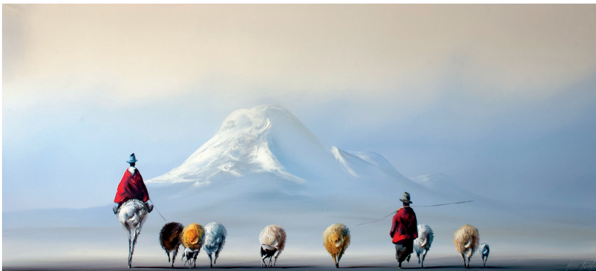
DE REGRESO A CASA Óleo sobre lienzo 180 x 80 cm