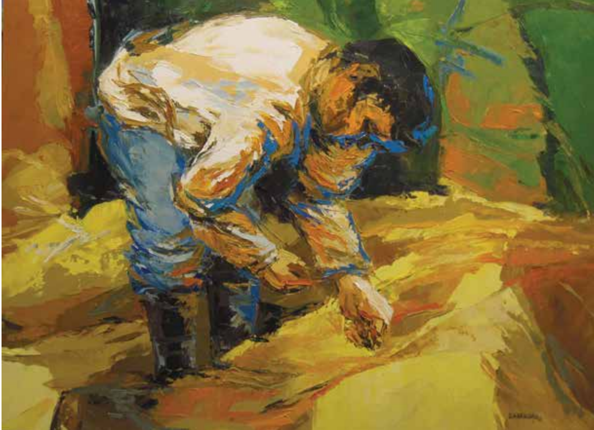
El sembrador, óleo sobre lienzo, 60x80

pide acogida de amor y de discernimiento de la Palabra para no confundirlo con las propias fantasías. Que inicia un proceso vivo, existencial. Luego esta vivencia no deja igual a la persona, la cambia y la lanza a la misión. La misión es un movimiento que no para jamás, que lleva más allá de las fronteras, a todos los rincones. El kerigma es anuncio testimonial, que está en la base, por eso es primer anuncio. Es el anuncio fundamental, aquello sin lo cual lo demás quedaría en el aire. Busca generar la vida de fe. Es la invitación a recibir a Jesús como Salvador y Señor, pero es un anuncio trinitario, porque se habla de Cristo como enviado del Padre con la fuerza del Espíritu. Este anuncio es una invitación emotiva y cordial porque se dirige al corazón, a ese centro donde se toman las decisiones existenciales y definitivas. Hay que tener puntería, hay que disparar al corazón. No es una invitación a aprenderse algo con la cabeza sino a decidirse por Alguien. Es un anuncio que suscita una profunda emoción (Hch. 2, 37). Un anuncio vivido comunitariamente, que funda la Iglesia.