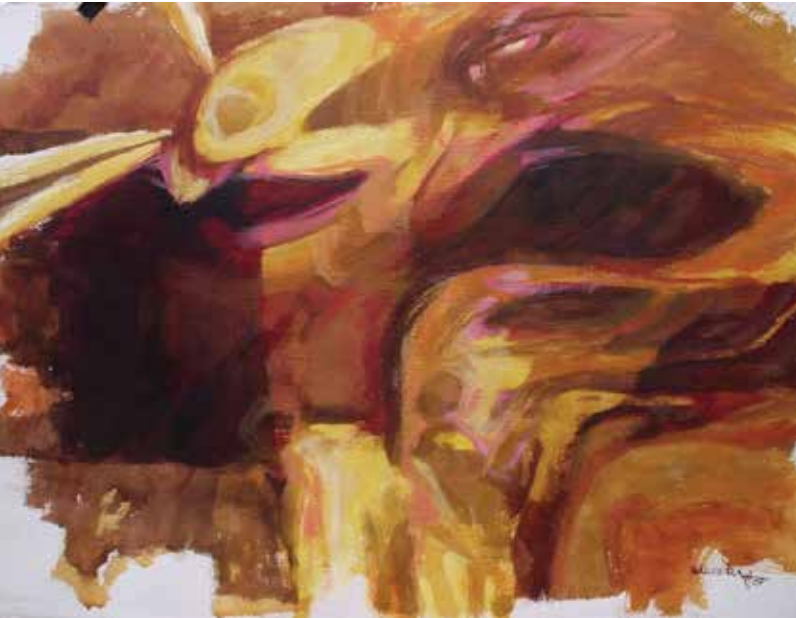
El sol es de todos, acrílico sobre papel, 57x77

ovejas me conocen a mí...y doy mi vida por las ovejas” (Juan 10, 14-15).