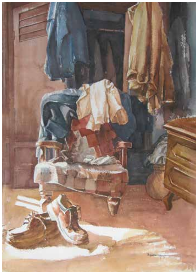
El rincón de las ausencias, acuarela, 70x50

El agente de pastoral está llamado a ser un pedagogo de la comunicación. Quiere y busca que el mensaje se haga vida. En Jesús tenemos siempre el modelo, el camino, la vida. Como el Maestro Bueno, cada agente de pastoral deberá