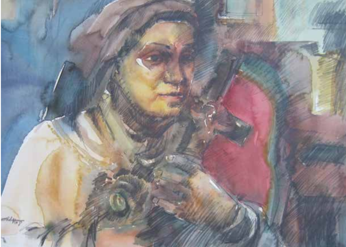
Demostración de fe, acuarela

La Pastoral Juvenil no inventa a los jóvenes, en el nombre de Jesús, los encuentra como son y donde están. La escena de “desertificación espiritual” (usando las palabras de Benedicto) o del “embate” (según el Papa Francisco) en el siglo XXI, es el contexto real y concreto en el cual estamos llamados a trabajar no sólo para los jóvenes sino con los jóvenes y entre los jóvenes.