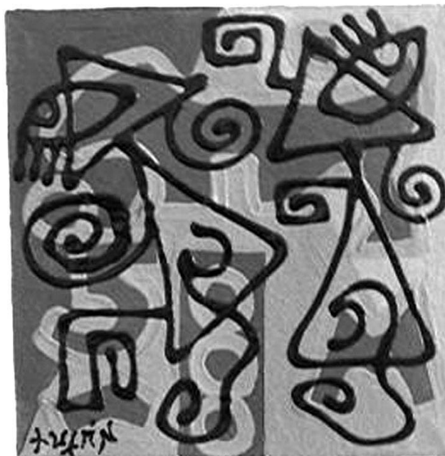
Acrílico sobre papel hecho a mano

De todos lados nos llegan mensajes sobre los problemas ambientales locales, nacionales y mundiales. Ahora algo está ocurriendo que antes no pasaba . El carácter inaudito busca reconocimiento en la política internacional, sin mucho éxito en la política nacional. No es más la repetición, algo emerge con un rostro monstruoso y apocalíptico. Sus características son tan letales que no parecen reales. El presagio pierde su condición futurista pues no señala el adveni-