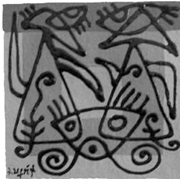
Acrílico sobre papel hecho a mano

El topos de la nueva política nos exige no sólo una relación con un mundo diferente sino también la afirmación del planeta dentro de un universo que con-