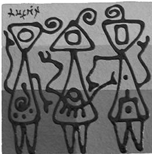
Acrílico sobre papel hecho a mano

Una política ambiental auténtica dialectiza la ideal- politik con la real- politik porque quienes parten de la realidad desconocen incertidumbres, quienes parten de ideas caen en una serie de promesas abstractas. Ni las ideas ni las realidades pueden dejar de lado la discusión sobre lo posible. No todo es posible en un momento determinado. Lo posible tiende a convertirse en imposible. Tener políticas ambientales en el contexto actual es posible, sin embargo, dicha labor se ha convertido en imposible por quienes se enriquecen a costa de un desarrollo lineal, mecánico y brutal para la naturaleza y la salud de las poblaciones y el equilibrio del planeta. Pero así como lo posible se ha convertido en imposible tenemos que hacer la apuesta para que lo imposible se convierta en posible. En consecuencia, la política ambiental tiene la obligación de una mayor audacia. Lo único que nos está prohibido es la superación del segundo principio de la Termodinámica el cual nos recuerda que no hay historia segura, que nada ni nadie es inmortal, que no hay paraíso terrestre y no existe el movimiento