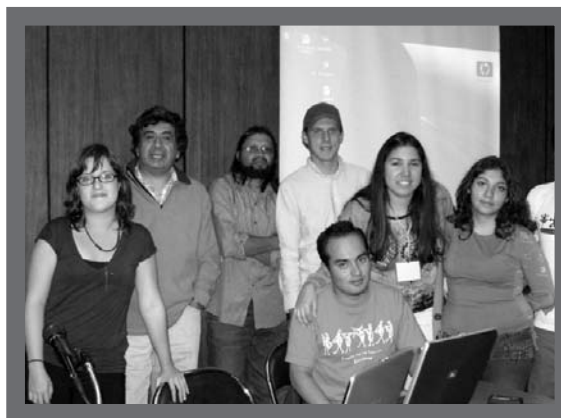
Organizadores del encuentro

Vimos como el tema de género no es un problema que atañe solamente a las mujeres, si-