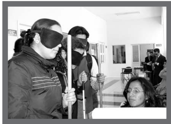
Evento interactivo sobre la ceguera

La Semana de la Comunicación se realiza en la Sede Quito desde los inicios de la Carrera de Comunicación Social con el fin de incentivar la participación y vinculación de estudiantes, docentes y autoridades así como para fortalecer la propuesta pedagógica. El tema escogido para la edición 2007 (28 de mayo al 1 de junio) permi-