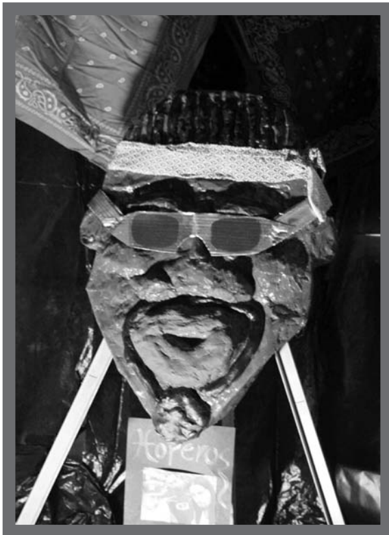
Muestra de máscara: Personaje urbano

tió integrar tanto lo cotidiano como lo teórico, lo político, lo cultural y social.