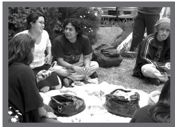
Compartiendo la comida

El encuentro pretendió responder a un vacío fundamental: la necesidad de construir una propuesta propia en torno a las Ciencias Sociales, tanto para la producción de teoría y conocimiento, cuanto para su compromiso real con la política, la sociedad y la cultura de nuestro país.