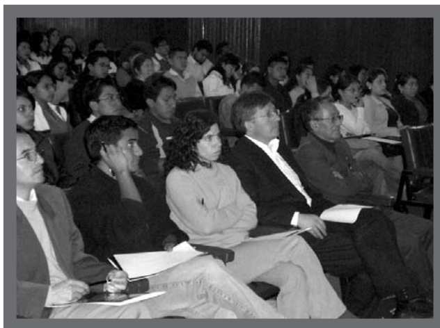
Asistentes al encuentro de Filosofía

Los talleres incluyeron, además, temas relacionados con las TICS, el desarrollo del pensamiento, psicolingüística, filosofía para niños y pragmática filosófica.