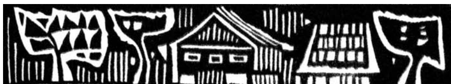
Oficios del río, xilografía a color. Fragmento. 1983