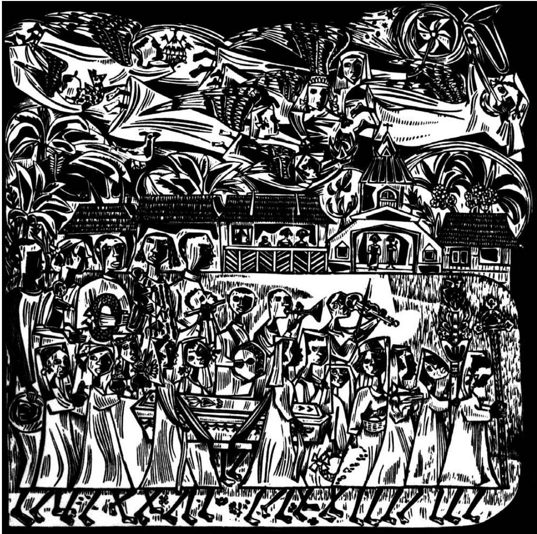
Entierro de la niña negra. Xilografía en negro y celeste Premio bienal de Badalona de grabado (Barcelona 1956)