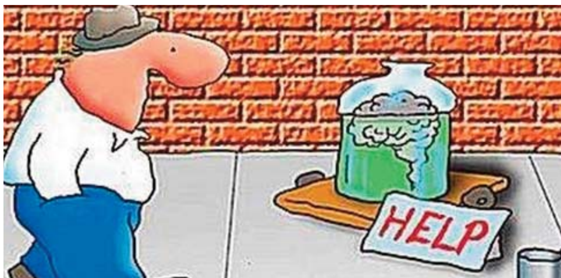
Figura 5. Reivindicación de la estimulación cerebral.

Nota 1. Sirva como ejemplo "Blood flow" del grupo Ritual https://www.youtube.com/watch?v=3HypZ87tF2Q , aunque queda a elección docente.