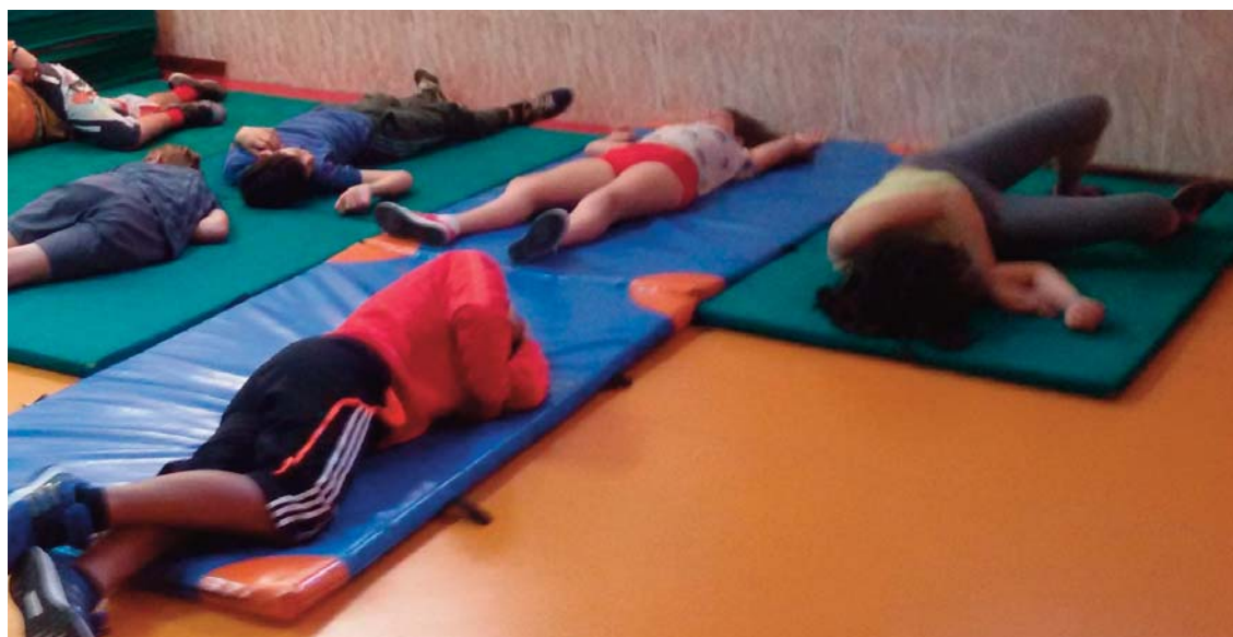
Figura 3. Alumnos desarrollando la actividad

«Somos moléculas sanguíneas que formamos parte de la sangre: tenemos una misión, ¡llegar a cada una de las células del cuerpo y llenarlas de energía! Estamos en la aurícula izquierda del corazón... Y estamos cargados de energía y nutrientes... Tenemos muchas ganas de salir del corazón a cumplir nuestra misión... Estamos preparados para salir, para que la sístole del corazón dé la salida... ¡Ya! El corazón nos bombea... y fluimos enérgicamente por la arteria aorta... Rebosamos energía... Fluimos velozmente por grandes canales de sangre: las arterias... Abandonamos las arterias y tomamos un pequeño camino que nos llevará hasta el destino: los capilares. El canal es mucho más pequeño y sinuoso. Viajamos más despacio, hasta que... ¡por fin llegamos a destino! Las células del organismo necesitan nuestra ayuda... somos los mensajeros de la energía y los nutrientes... transferimos