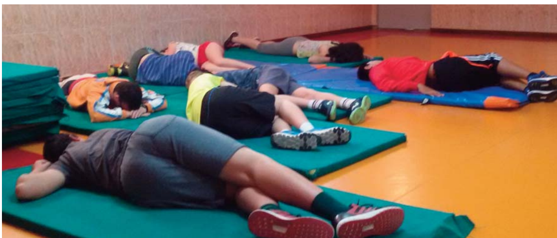
Figura 3b. Alumnos desarrollando la actividad

Para reforzar el aprendizaje a través de la fantasía, es conveniente la realización de un dibujo sobre lo que ha evocado la actividad