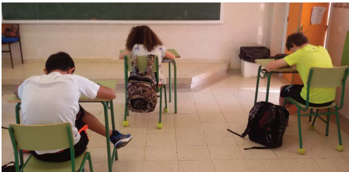
■ Figura 4. Alumnos realizando el dibujo