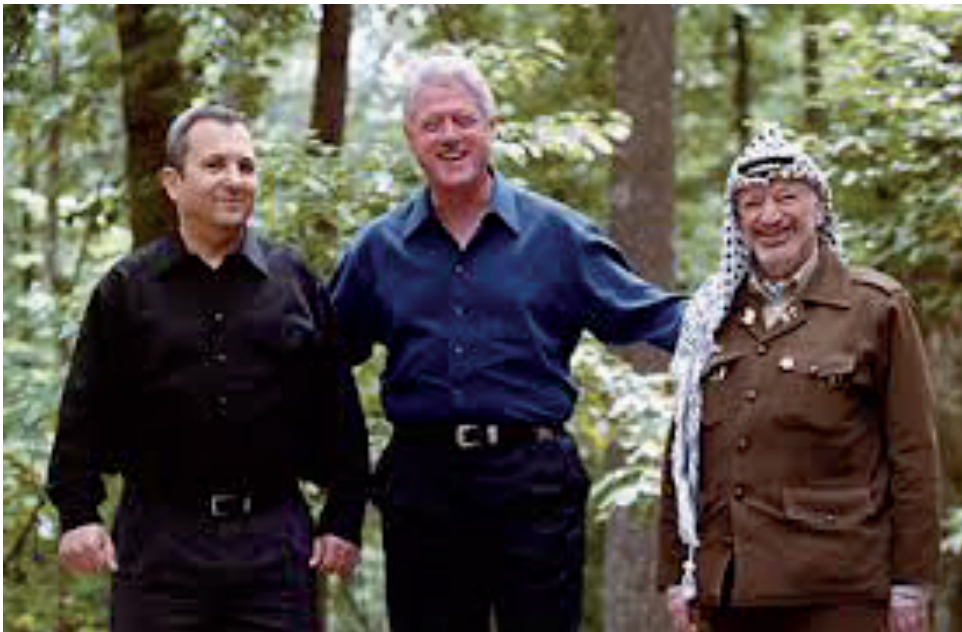
Julio de 2000, cumbre de paz en Camp David entre el primer ministro Ehud Barak y Yassir Arafat, con el presidente Clinton como sponsor e impulsor.

Arafat se mostró totalmente inflexible sobre cualquier posibilidad de concesión de soberanía sobre la explanada 23 , y no aceptaría nada que fuera en contra del total control palestino de Jerusalén este. Clinton era consciente que ello era igualmente inaceptable para el primer ministro.