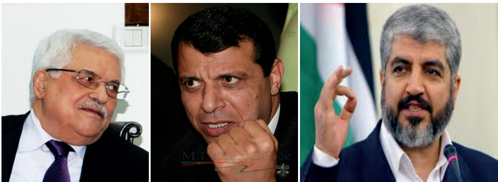
Mahmoud Abbas y Mohamed Dahlan, en el centro, ambos enfrentados por el control político por parte de Fatah en la franja de Gaza, ante el delirio de HAMAS, cuyo líder es Khaled Mershaal, en la foto de la derecha, y que actualmente reside en Doha, Qatar.

Es evidente que la ANP solamente gobierna en Cisjordania, y no en Gaza, pues no está interesada en asumir el control de esta zona tan convulsa, en particular lo que concierne a la seguridad. Abbas teme que si asume dicho control esto le suponga un desgaste que vaya en beneficio de Hamas y esta aproveche para hacerse más fuerte en Cisjordania. A ello se ha de añadir que los israelíes hacen lo posible para alimentar el alejamiento entre las dos subentidades palestinas, ya que ello le conviene al obstaculizar este hecho el establecimiento del estado palestino que tanto quiere impedir Israel.