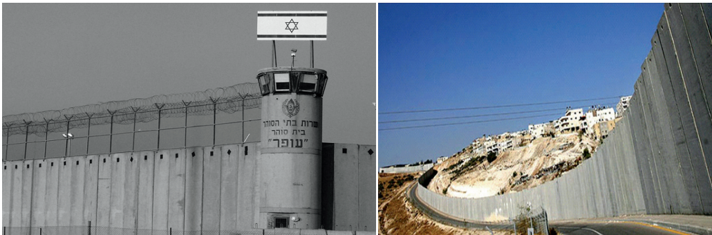
Imágenes del muro de separación entre Cisjordania e Israel, y que no coincide con la “línea verde”.

Sharon, en el 2003, comenzó a plantear un cambio de estrategia, que no fuera incompatible con la «hoja de ruta», con el objeto de ir adoptando una política de separación de los palestinos para aplicar una serie de medidas unilaterales entre las se encontraba la retirada total de la franja de Gaza, considerada como un lastre para Israel, y el desmantelamiento simbólico de algunos asentamientos de Cisjordania 33 . Con estas acciones Sharon transmitiría a la comunidad internacional, en especial al «cuarteto» 34 , su intención de contribuir decisivamente a la paz al ir retirándose de los territorios ocupados. Además, con ello trasladaba la responsabilidad de la seguridad en Gaza a los palestinos, que ya se sabía que tenían importantes disensiones entre Hamas y la ANP.