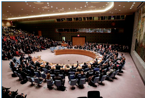
Votación del Consejo de Seguridad de la ONU para aprobar la resolución 2253 contra la financiación de ISIS-Daesh (17.DIC.15)

Se prohíbe expresamente la formación en materia militar a DAESH y se insta a que los Estados miembros se proporcionen recíprocamente el máximo nivel de asistencia en lo que se refiere a los procedimientos penales relacionados con los actos de financiación del terrorismo. Hace hincapié igualmente en la importancia de que los Estados se cercioren de que cualquier residente en su territorio no ponga recursos financieros a disposición de DAESH, al Qaeda u otras personas físicas o jurídicas afines, bloqueando las transferencias internacionales con destino al grupo terrorista y atacando así la raíz del problema. La actividad legislativa del Consejo de Seguridad ha sido frenética en los últimos meses 24 , consciente de que el conflicto en Siria se recrudece y que se ha convertido en un factor de inestabilidad global que es preciso neutralizar.