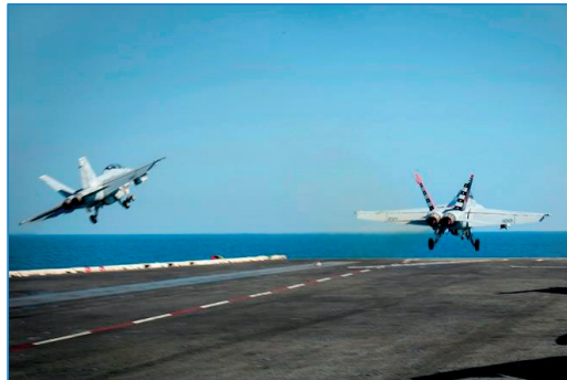
Dos F18 Super Hornet lanzados simultáneamente desde el portaaviones USS CVN 70 Carl Vinson durante la operación Inherent Resolve contra Daesh (OCT.14)

desplome de las divisas regionales y permite la liberación de detenidos mediante el pago de fianzas en euros o dólares.