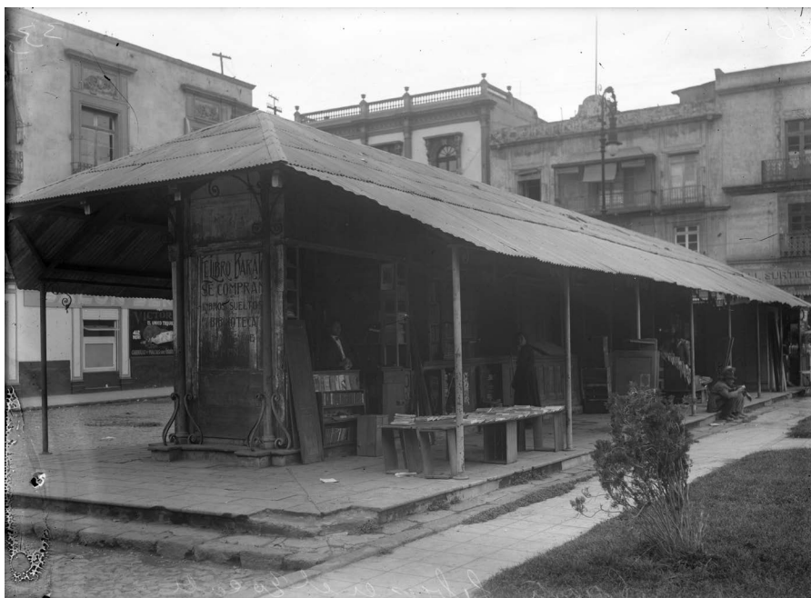
Imagen No. 2. Alacenas del mercado de Libros del ex Seminario a principios de la década de 1920.

Libros de texto para las escuelas, novelones sensacionales, librillos vistosos y por lo común sandios cuando no infestados de pornografía, folletos y libracos de cuentos verdes, y producciones asquerosas de plumas libertinas, obras truncas y multitud de impresos y de estampas y fotografías sin valor ni atractivo, resto despreciado de las bibliotecas, eso es todo lo que ahora se compra y vende en el Mercado de Libros... ¡Con razón están de pésame los bibliófilos! (Prantl y Grosó, 1901: 905-906). 35