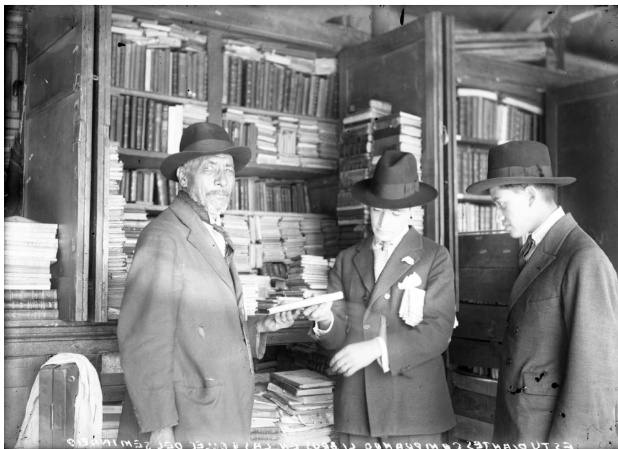
Imagen 1. Librero de viejo del mercado del ex Seminario atendiendo a un par de estudiantes.

en mayor medida artículos nuevos, también conformaban su catálogo con aquellos libros de “lance”, o sea, usados, discontinuados o antiguos. 16 La Librería Porrúa y la Librería Robredo que surgieron en estos años y que se proyectaron a lo largo de todo el siglo XX, se caracterizaron precisamente por ofrecer una combinación de libros nuevos, viejos y aquellos para coleccionistas. 17 Por otro lado, “extrañamente”, muchas veces libros nuevos, recién puestos en circulación, aparecían entre las ofertas de los expendedores de libros viejos. 18