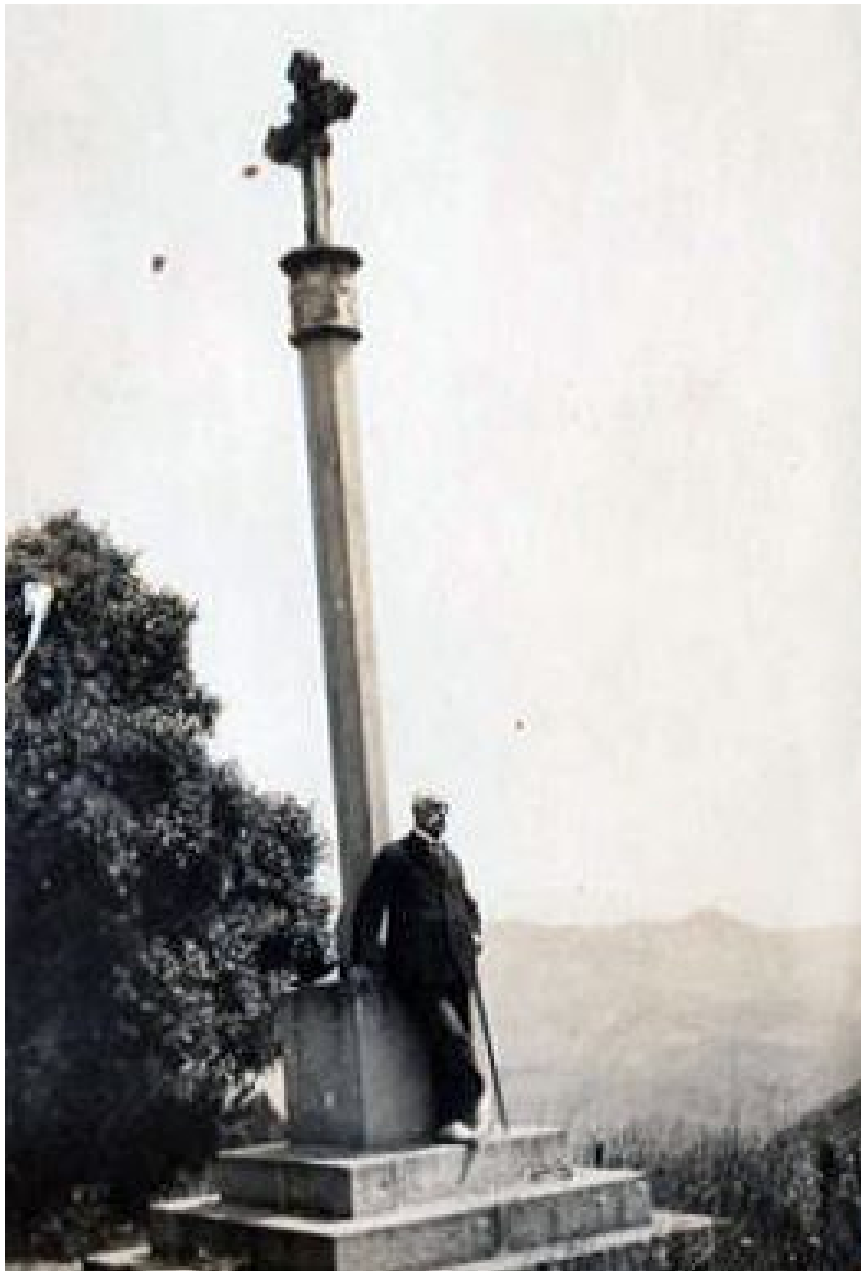
1931. Una altra de les seves dilectacions fou Escornalbou, on el veiem a la creu de terme de l'abat Guimerà de Poblet. (Procedència Joana Casals (àlbum) Arxiu Escola de Bibliotecàries).