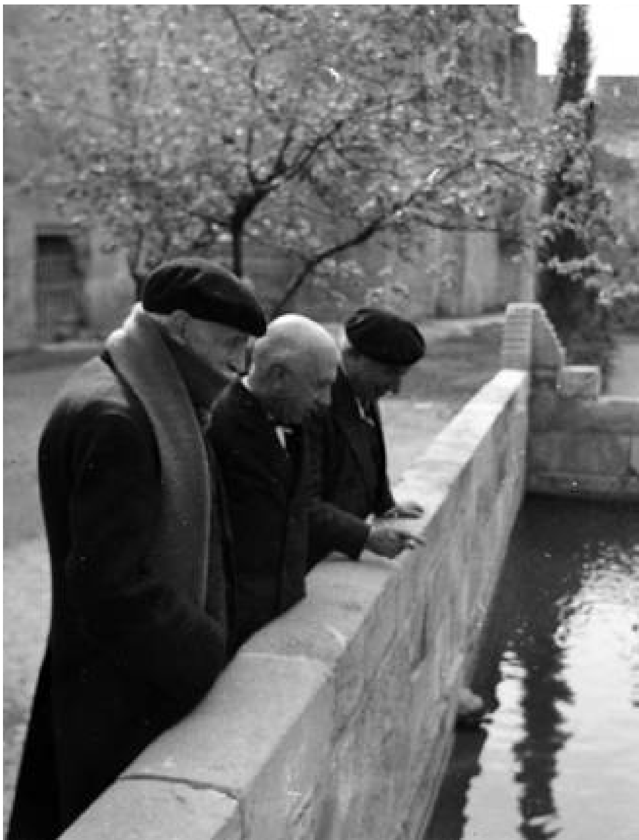
1936. Toda, Guitart i Maspons al costat d'una bassa del monestir de Poblet. (Autor Francesc Blasi Vallespinosa. Fons: Francesc Blasi Vallespinosa. Centre Excursionista de Catalunya).