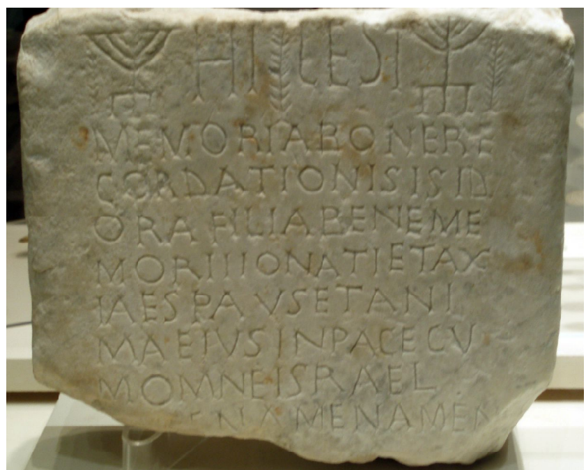
Lauda sepulcral d'Isidora, dels Pallaresos. Segle VII.