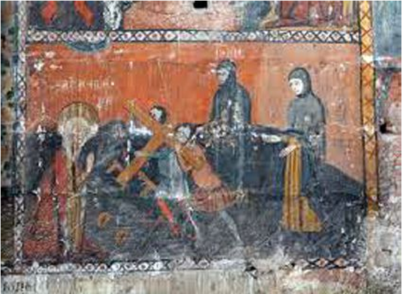
Pintura mural de la capella de Santa Elena, Catedral. Segle XV.

certa importància, com és el cas de Tarragona. La comunitat de Tarragona en molts moments va ser l'aljama més destacada i lloc de recollida de tot tipus d'impostos (els jueus de Valls, Alforja, Vallmoll i Alcover van formar part de la subcol·lecta de Tarragona). A la comunitat, hi van destacar els comerciants, artesans, seders, pergaminers, sastres, joiers, grans metges i cirurgians jueus tarragonins... L'any 1264 la comunitat va aconseguir el privilegi que cap cristià pogués entrar ni empresonar un jueu dins la sinagoga.