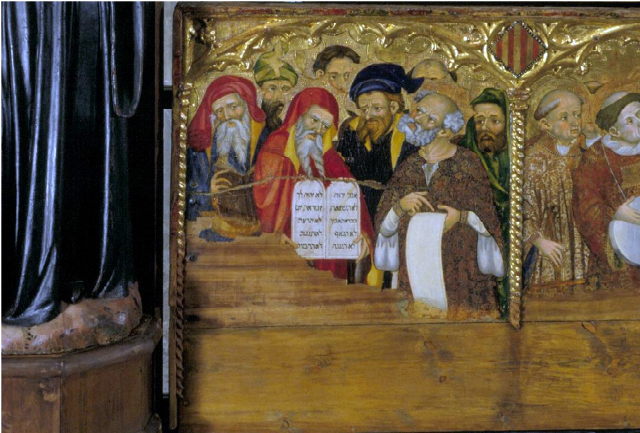
Detall dels profetes. Predel·la del retaule major de Santes Creus, de Lluís Borrassà. Segle XV.

- Siglo XX, el reencuentro entre aragoneses y judíos de origen aragonés. CEHIMO. Monzón, 2016.