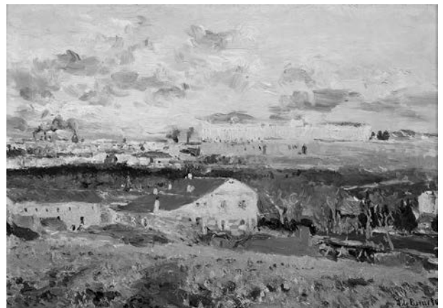
Figura 2. La Casa del Sordo (Madrid) en 1907. Lienzo de Aureliano de Beruete. Obra actualmente expuesta en el Museo del Prado.

En 1844 solicita autorización para fundar una nueva población, denominada Isabela de Guisando (en honor a la reina), en la finca de El Tiemblo, un lugar de espectacular belleza, siendo autorizado por Real Orden del Ministerio de Gobernación en 1845 (Cuarteto, 1952). Pero