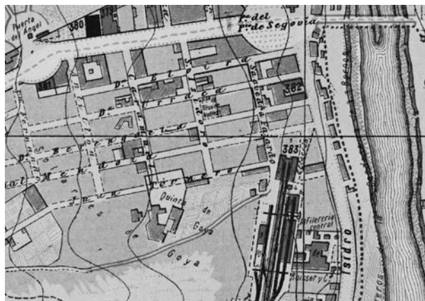
Figura 6. Situación en detalle de la Quinta de Goya, también conocida como Quinta del Sordo, plano de Madrid de Facundo Cañada (1900).

Ese mismo año establece en Madrid una fábrica de fundición de minerales, llamada La Pura, en la Quinta del Sordo o Quinta de Goya (Fig. 6), finca en la que vivió y trabajó su abuelo, que le donó en vida en 1823, y que él transfirió a su padre hacia 1830. Se trataba de una casa de campo rodeada de una extensa finca, de más de 10 hectáreas, situada cerca del Puente de Segovia, en la