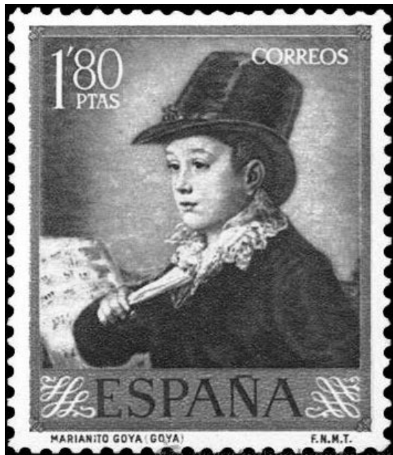
Figura 1. El segundo retrato que Goya hizo de su único nieto como motivo de uno de los sellos de la colección conmemorativa del pintor, 1958. Actualmente, el retrato pertenece a la colección del Duque de Alburquerque.

El nieto de Goya fue un claro ejemplo de este fenómeno social, en el que mientras unos pocos se enriquecieron, para otros supuso una verdadera ruina.