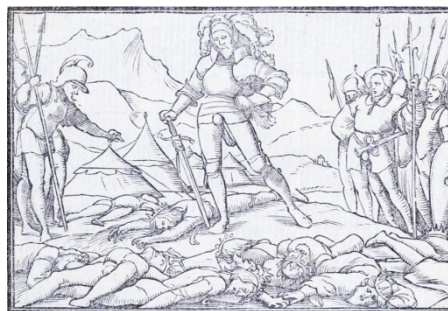
Fig. 5. Retratos o tablas de las historias del Testamento Viejo, Lyon, 1543