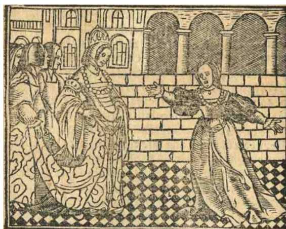
Fig. 10. Cárcel de amor , Zaragoza, 1551