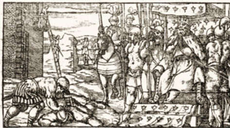
Fig. 17. Orlando furioso , Venecia, Gabriel Giolito, 1542

este caso numerado como canto IV) y posteriormente en Lyon, en 1550, en las de Guillaume Roville. En este canto orlandiano se narra cómo, durante su viaje a Escocia, Rinaldo (Renaldos) conoce, a través de Dalinda, los amores secretos entre la princesa Ginebra y el caballero Ariodante y las tentativas del celoso duque Polineso de separarlos con engaño.