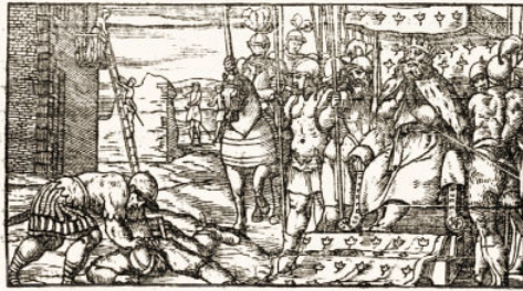
Fig. 17. Orlando furioso , Venecia, Gabriel Giolito, 1542

para la canonización editorial del poema, presentándolo como un nuevo clásico o como un clásico moderno 32 .