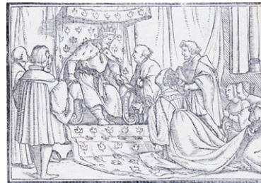
Fig. 6. Retratos o tablas de las historias del Testamento Viejo , Lyon, 1543

Gabriel Giolito envuelve el texto ariostesco con nuevos y ricos materiales paratextuales, entre ellos los resúmenes de los cantos y las breves alegorías de Ludovico Dolce que le confieren un significado moral (Cerrai, 2001: 101). En la edición de 1542, el poema se enriquece también con un nuevo programa iconográfico que, frente al de otras ediciones anteriores, presta más atención a la materia poética y muestra una nueva conciencia de la complejidad estructural del poema. Así como en los grabados de la edición del Orlando furioso de Zoppino (1530, 1536) se fija o inmortaliza un momento, una instantánea de la historia, en cada una de las xilografías de Giolito se presenta una imagen plurinarrativa en un reducido espacio (6,5 mm x 12 mm) que condensa la materia del canto y la fija en la mente del lector (Cerrai, 2001: 105, nota 20). Se muestra una escena múltiple constituida, en la mayoría de los casos, por no más de dos núcleos episódicos distintos dispuestos en varios planos, asignando el primero al episodio que, a juicio del ilustrador, resulta más importante en el interior del canto. Como en tantas otras ocasiones, también en esta se desconoce la identidad del artista o artistas de estos grabados 33 .