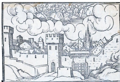
Fig. 4. Retratos o tablas de las historias del Testamento Viejo, Lyon, 1543