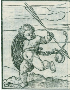
Fig. 15. Les images de la Mort , Lyon, 1562