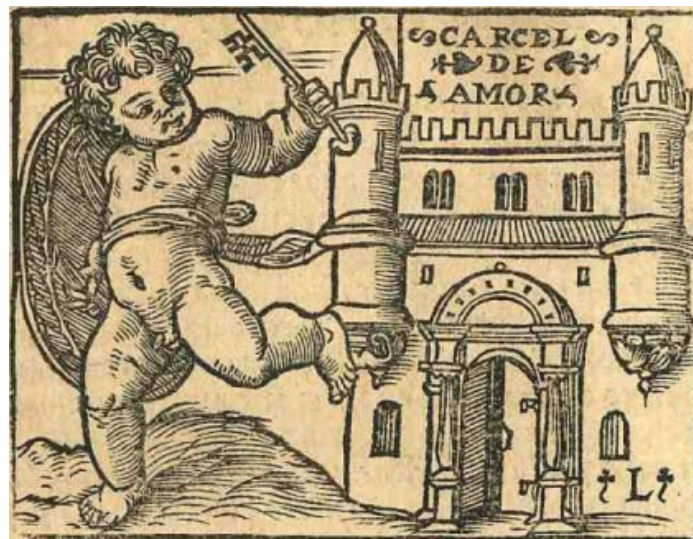
Fig. 14. Cárcel de amor , 1551

título, pero con evidentes modificaciones. Como en los casos anteriores, el grabado (fig. 14) no es original y resulta de la copia y unión de dos estampas diferentes inspiradas en las obras antes comentadas. El grabador funde en una sola xilografía un grabado de los Retratos y otro de Les images de la Mort . De los Retratos toma la estampa que representa la visión del nuevo templo de Jerusalén según la descripción del profeta Ezequiel (fig. 16), precedida de una cita latina del libro de Ezequiel, capítulo XL (“Ezechieli prophetae futura restauratio civitatis & templi in visionibus ostenditur”) y seguida de una cuarteta que dice: “A Ezechiel demostrado / Fue en visión muy claramente / Que el templo ya derrocado / Sería bien restaurado / Y la ciudad juntamente” (h. L3r.). Si en el texto bíblico se describe con detalle el nuevo templo, sus alturas en codos, puertas, dependencias y adornos, en el grabado se presenta solo la fachada. El monogramista L por su parte ha copiado solamente la parte central del grabado originario, la correspondiente a la puerta oriental del templo contemplado en su visión y ha sustituido la inscripción de la cartela central por la de “Cárcel de amor”, equivalente a la filacteria que identifica el edificio y da título al libro en las ediciones incunables (fig. 11).