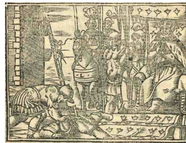
Fig. 18. Cárcel de amor , 1551