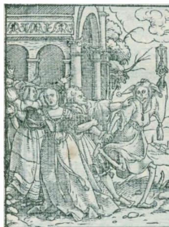
Fig. 9. Les images de la Mort , Lyon, 1562