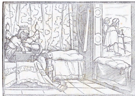
Fig. 2. Retratos o tablas de las historias del Testamento Viejo , Lyon, 1543

La estampa aparece encuadrada entre una cita latina (“David spiritu Dei afflatus, beatitudines vir describit. Impiorum quoque & infidelium interitum praedicit”, Psalm, I) y una quintilla que destaca esta imagen del rey escritor autor de los Salmos: “David con la gracia y don / De Dios describe y advierte / Los bienes del buen varón, / Y también la maldición / De los malos y su muerte” (h. K3r.). Holbein lo representa ensimismado en la escritura en la soledad y quietud de una cámara renacentista, ricamente adornada con una cortina al fondo y cojines en el alféizar, con el arpa colgada en la pared. Sentado en un rico sillón, compone en la mesa los Salmos, al primero de los cuales (“Bienaventurado es el hombre que no anda en el consejo de los impíos ni se detiene en el camino de los pecadores”)