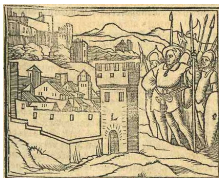
Fig. 3. Cárcel de amor , Zaragoza, 1551

Tras un grabado (modelo 2, caballero y dama dialogando) todavía no identificado, pero sin relación con las series holbeinianas, encontramos otra xilografía que representa a unos caballeros a las puertas de una ciudad (fig. 3). El grabadito resulta de la unión de dos xilografías de los Retratos (fig. 4 y fig. 5).