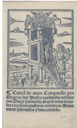
Fig. 12. Zaragoza, 1523