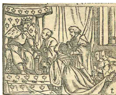
Fig. 7. Cárcel de amor , Zaragoza, 1551

Holbein presenta al rey de Persia sentado en un trono adornado con un sembrado de motivos vegetales que se han identificado con lirios o con la flor de lis, emblema heráldico de la monarquía francesa (Woltmann 1869: 28), aunque también muy utilizado como tema ornamental en la Europa occidental (Pastoureau, 2006: 118). La misma decoración aparece en otras obras de Holbein, por ejemplo, en el trono del rey sentado a la mesa en la Danza de la Muerte , en la “Cólera de Roboam”, recreada en el fresco que adorna una de las paredes de la Grossratsaal del ayuntamiento de Basilea (Salvini/Werner Grohn, 1972: 91-92, fig. 30j) o en la pintura, un poco posterior (c. 1535 y 1540), del rey Enrique VIII recibiendo, cual Salomón, a la Reina de Saba ( Collection of His Majesty the King en el Castillo de Windsor).