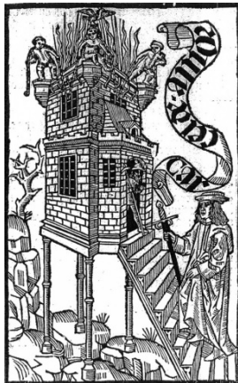
Fig. 11. Barcelona, 1493

Si bien el único ejemplar conservado de esta tardía edición está mudo de sus primeras hojas, su portada originaria sería idéntica, como ya se ha dicho, a la que abre la continuación de Nicolás Núñez (fig. 13). No tendría mucho sentido haber creado este grabado aparentemente ex profeso para ilustrar la Cárcel de amor y emplearlo solo para la adición de Núñez. El tamaño del grabado es similar al de los anteriores y aparece enmarcado y enriquecido por una orla formada por distintas piezas xilográficas, parejas a las utilizadas en las portadas de otras obras salidas de su taller 29 . A priori, sorprende la imagen elegida para adornar la portada porque, aparentemente, nada tiene que ver con la de las primeras ediciones. En la traducción catalana, y presumiblemente en la edición zaragozana de 1493, en la portada se alza el edificio de la cárcel (“vi cerca de mí, en lo más alto de la sierra, una torre de altura tan grande que me parecía llegar al cielo”, Parrilla, 1995: 6), erigido sobre cuatro pilares y por cuyas escaleras asciende el Autor con la espada en la mano para rescatar al prisionero Leriano. La filacteria que ondea por encima del edificio lo identifica y da título a la “novela”: Cárcel de amor (fig. 11).