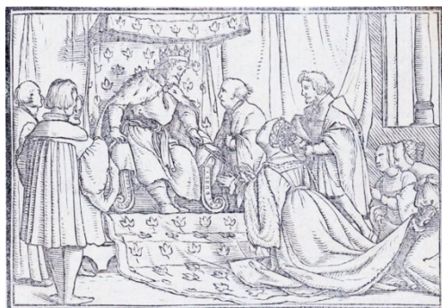
Fig. 6. Retratos o tablas de las historias del Testamento Viejo , Lyon, 1543

De los Retratos copia fielmente el grabado que ilustra el libro I y II de Esther, en concreto el momento en el que el rey Asuero repudia a Vasthi por desobediente al no comparecer en el banquete a su requerimiento y elige a Esther como nueva esposa, momento que inmortaliza la quintilla: “El rey Assuero mostrando / Su grande gloria y poder / Un combite celebrando / A Vasthi muger dexando / Escoge de nuevo a Ester” (h. K1v.) (fig. 6).