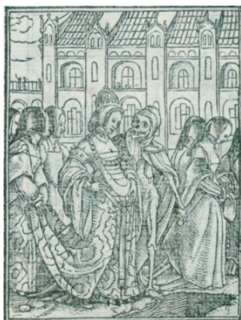
Fig. 8. Les images de la Mort , Lyon, 1562

ninguna de las anteriores a estas se recoge el grabado del niño con flecha en la mano (fig. 15) que, como se verá, le sirve para construir la portada de la continuación de Nicolás Núñez y, supuestamente, la de la Cárcel de amor (fig. 13). De Les images de la Mort , el monogramista L toma en concreto tres grabados, dos de los cuales pertenecen a imágenes de Holbein (fig. 8 y fig. 9) 27 .