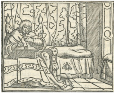
Fig. 1. Cárcel de amor , Zaragoza, 1551

El grabado elegido para representar a Leriano escribiendo (fig. 1) es, como ya se ha dicho, el del rey David componiendo los Salmos (fig. 2), procedente de los Retratos o tablas de las historias del Testamento Viejo .