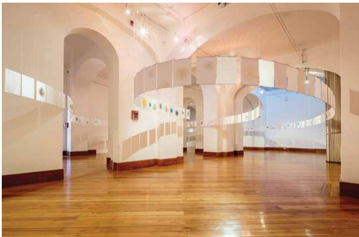
Cartografía Interior , CAC, 2015.

y escrito de dos tratados antiguos sobre el yoga como sus guías de resolución: el Bhagavad-Gita y Yoga-Sutras de Patañjali. A través de la línea del laberinto a lo largo del espacio de exposición, se hace el recorrido de aproximadamente 240 láminas con gráficos y textos. Ante los ojos del espectador se expone esta “vivencia” del recorrido a partir del estudio de sus enseñanzas. “Para nosotros este trabajo es un recorrido de vida; implica un viaje que tiene diferentes escalas, cuyas estaciones las van marcando los dibujos” (Flores: 2015, 54).