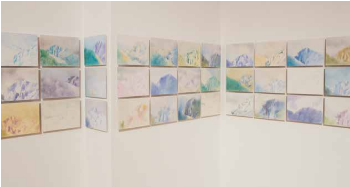
Instantes , CAC, 2015.

de los opuestos. Los pigmentos característicos de la montaña (marrón) y el mar (azul índigo) fueron expuestos uno junto al otro dentro de dos cuencos pequeños, convirtiéndose en punto central dentro del espacio vacío formado del blanco de las paredes y de la arena que cubría el suelo.