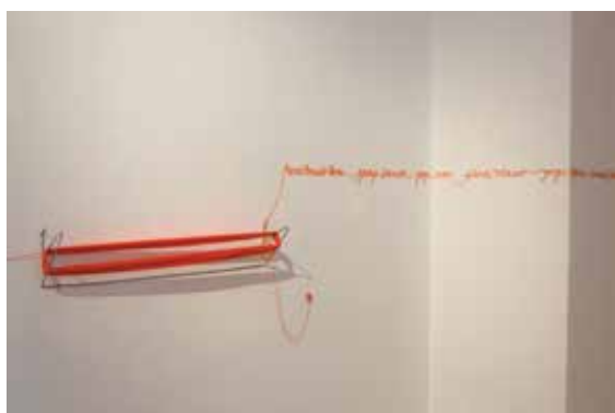
Comunidad Creadora CAC 2015.