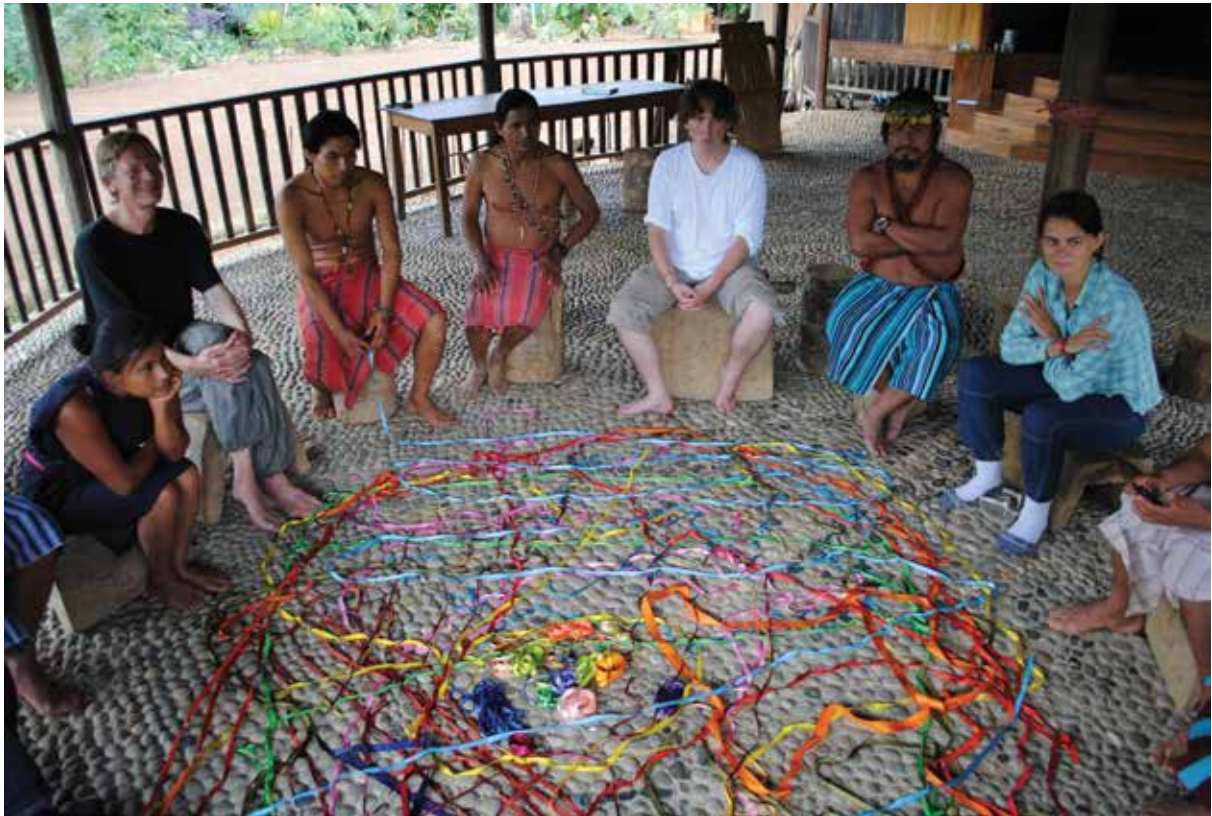
Yuwientza 2012.