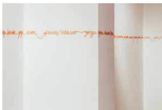
Comunidad Creadora CAC 2015.

Profesores y estudiantes de Quito, docentes alemanes y varios de los anfitriones de la comunidad participaron en la elaboración de un gran gráfico efímero a partir de figuras que cada miembro del grupo iba formando en el centro del círculo humano, luego de haber narrado un hecho que había marcado su vida. El resultado final fue un gran mandala que unía la energía interior de cada uno en el acto de develar su historia y en el de escuchar la del otro. Las líneas entrecruzadas y superpuestas eran el testimonio del profundo acto humano de darse y recibirse en la confesión.