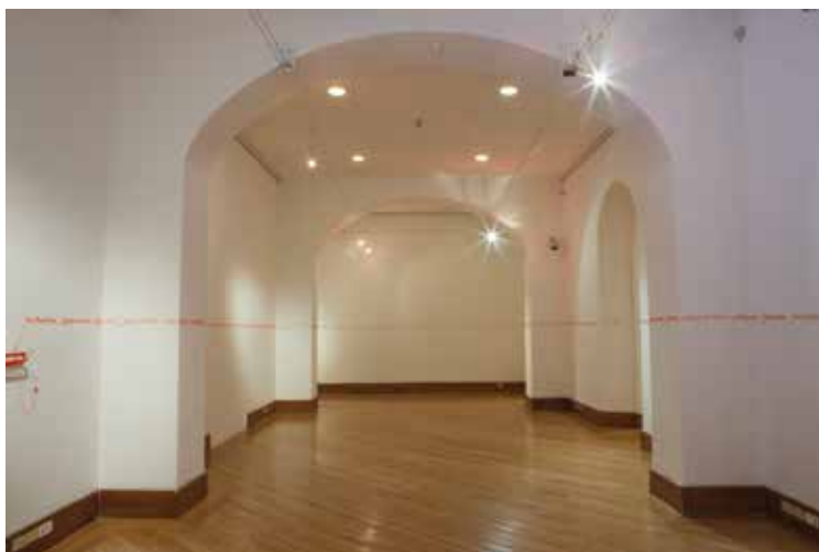
Comunidad Creadora CAC 2015.