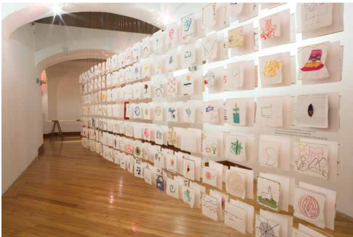
Tejido CAC 2015.

y provoca que toda la red se mueva” 23 . La labor del tejido, que sucedía simultáneamente desde diferentes puntos geográficos, concretaba el gran contenido del instante, de ese ahora con múltiples manos y fuerzas que iban interconectándose bajo la misma labor, en una variedad de formas y motivos libres nacidos de un impulso interno para crear una figura espontánea. Como resultado del proyecto, Pilar montó en “Aliento” la instalación a base de un conjunto ordenado a manera de gran cuadrícula de doble cara, cediendo el lugar central a un bordado hecho por ella misma con corteza del árbol weowe de la región del Yasuní, en conmemoración a las 150 mujeres amazónicas que caminaron 219 Kms., hasta Quito en defensa de la naturaleza 24 .