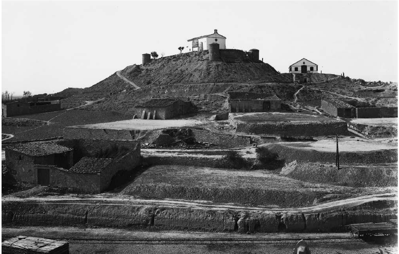
Figura 1. Vista de les fortificacions de la serra de Sant Eloi a principi del segle xx.

recinte que calia enderrocar. En concret, es refereix a «la segunda parte del recinto militar de la villa de Tàrrega que es indispensable para la construcción de la carretera». 2 Podria tractar-se d'un tram de la muralla que aniria des de la carretera de Tarragona fins al portal del carrer d'Agoders. De fet, es diu que «es la parte comprendida desde el ángulo del corral de D. Francisco Castellanos frente mi habitación hasta el huerto de D. Borjes de Lérida inclusive». 3 En aquest sentit, probablement es tractava d'un recinte situat a la cantonada de la carretera de Tarragona amb l'actual de Sant Martí de Maldà. Aquesta afirmació es ratificaria en un plànol que l'any 1874 realitzà l'enginyer Ramon de Ros, arran de l'avaluació de danys produïts per la rubinada de Santa Tecla (vegeu fig. 5). En el dibuix, s'hi aprecia el recinte militar a l'angle d'una parcel·la descrita amb el nom de «Huerto del Castellana», sobresortint cap a la carretera de Tarragona. Aquest plànol, precisament, tot i elaborar-se uns anys després