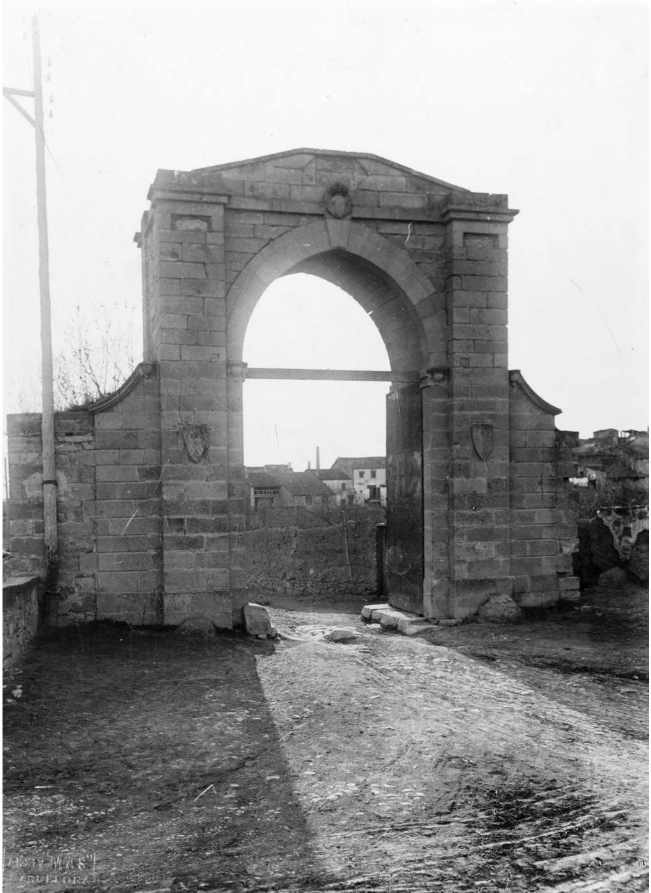
Figura 9. Portal de la muralla carlina de 1874 que donava a la carretera de Tarragona. 1928.