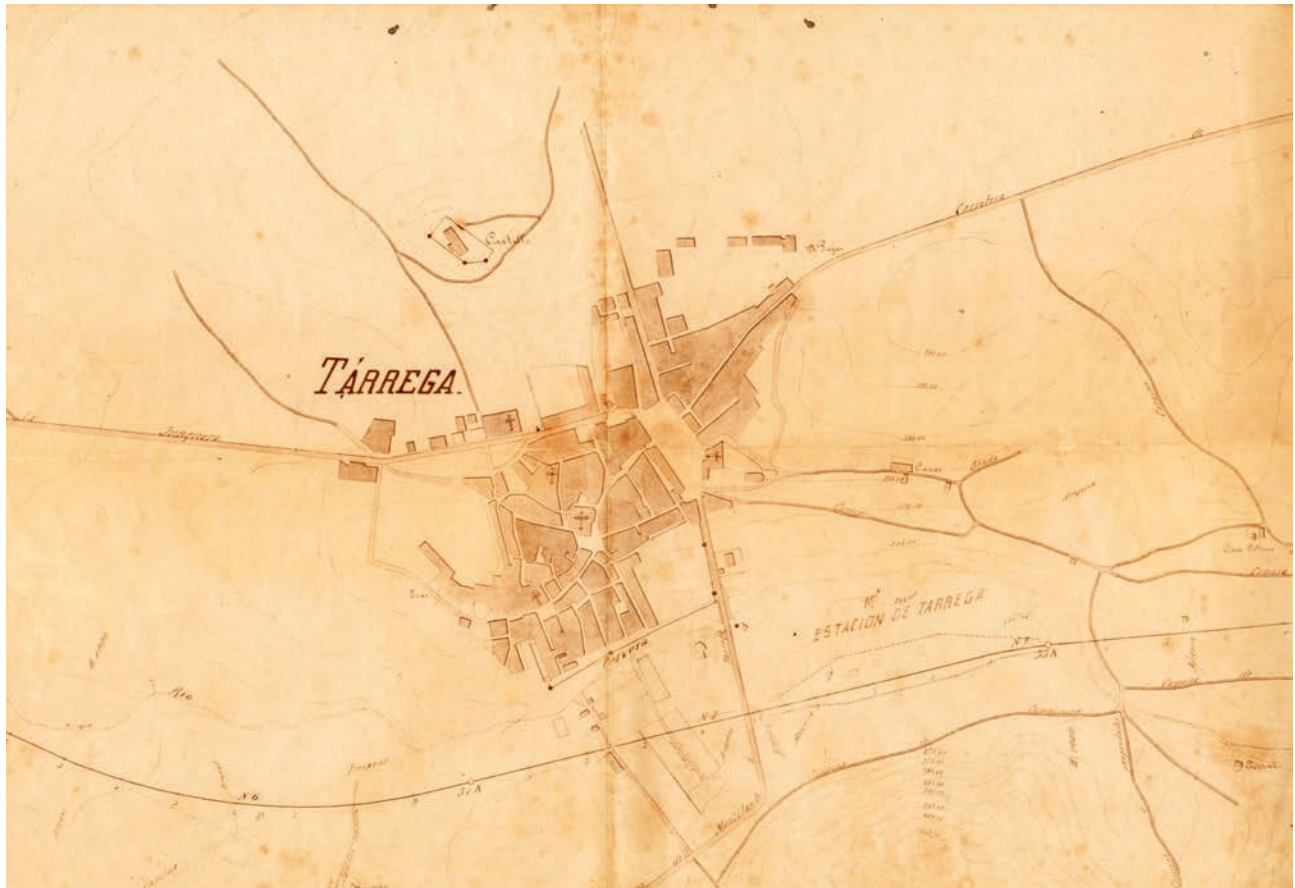
Figura 3. Plànol de Tàrrega de final del segle XIX (posterior a 1885) , on s'indica la muralla de l'actual carrer de Migdia, el traçat de la muralla amb dos tambors del carrer de Joan Maragall, ja desaparegut, i les fortificacions de la serra de Sant Eloi. Plànol publicat per Jaume Ramon a Nova Tàrrega , núm. 3660.

vila. El grup de cartes porta per títol Expediente solicitando el Ayuntamiento de Tàrrega la demolición de una torrica y un muro aspillerado . La primera carta és del comandant general de Lleida, José Rodríguez Soler, i s'hi autoritza l'Ajuntament a «demoler unos trozos de pared y un tambor aspillerado que formaron parte de la fortificación en tiempos de la Guerra Civil por estar en estado ruinoso e impedir el ensanche de aquella villa por aquel punto». 10 Malauradament, en els documents no es concreta on s'ubica la part de la muralla que està feta malbé. En tot cas, la referència és molt superficial, quan afirma «en atención a la inutilidad de la fortificación en aquel punto», 11 i afegeix «las paredes aspilleradas que sirvieron de muralla en la guerra civil». 12 Cal pensar, doncs, que seria una part de la muralla dins d'una àrea de creixement en expansió, com podria ser la carretera de Lleida a Barcelona, però és una hipòtesi que caldria verificar amb altres dades. De fet, la finalització de la Segona Guerra Carlina, mencionada com a guerra civil a la carta, provocava una relaxació per part de les autoritats militars