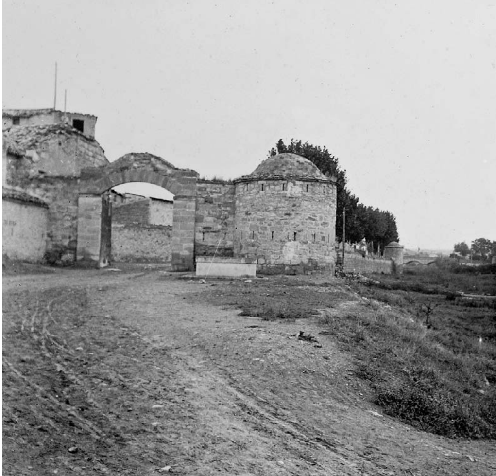
Figura 6. Imatge de principi del segle xx de la porta de la muralla a la sortida cap a la carretera de Sant Martí de Maldà, amb un torricó o tambor que actuava de cantonada de la muralla del 1874. Torricó encara conservat en l'actualitat. Biblioteca de Catalunya, fons Salvany.

luego hasta el puente de la carretera dándole a este muro el espesor de 0,60 m. Una altura de 3 m. Y una cimentación de 0,70 m. de profundidad. 18