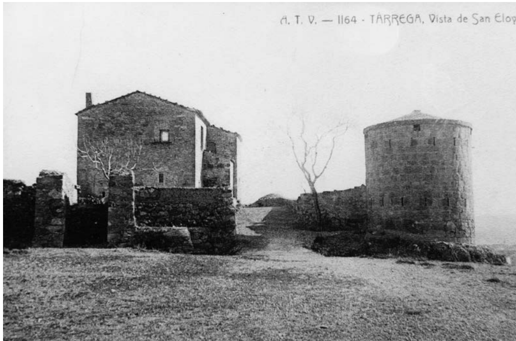
Figura 4. Torricó de la serra de Sant Eloi a principi del segle xx.

tería cuyo presupuesto también acompaño con el número 3 y cada importe debe sumarse a los gastos hechos por el ayuntamiento. La plaza de Tàrrega forma un cuadrilátero, en uno de los costados está la iglesia y en el de la izquierda del anterior, la casa ayuntamiento de modo que cruzan sus fuegos. Pero la comisión encargada de la defensa manifiesta que el hecho de construir en el centro de dicha plaza un reducto que enfile las cuatro calles que desembocan en los puestos medios de los lados de la misma, por temor de que sin él, puedan penetrar las facciones por una de dichas calles... 13