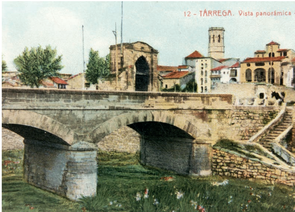
Figura 2. Vista de principi del segle xx del pont per on passa l'actual carretera de Tàrrega a Tarragona, amb la porta de la muralla que donava a aquesta carretera en segon terme.

pel recinte de la muralla es degué construir durant aquests anys. L'enginyer militar Joan Palou el descriu de la manera següent: