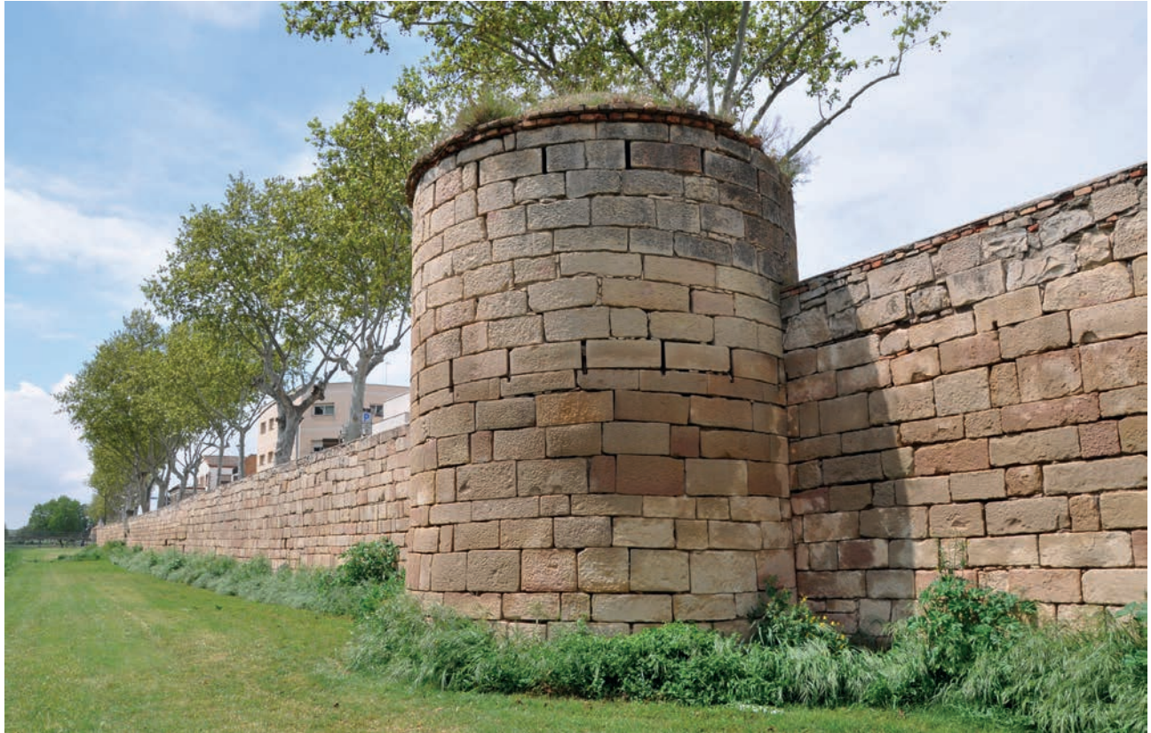
Figura 7. Muralla del 1874 vista des de vora el pont de la carretera de Tarragona cap al pont de Sant Agustí. El torricó que hi havia a l'altura del carrer de la Font, ara inexistent, fou destruït pels bombardejos de la Guerra Civil (1936-1939).

refer les fortificacions de Tàrrrega en plena guerra carlina s'esvaïren quan s'acabà la contesa i, al final, s'optà per fer un mur tocant al riu, que és el que tenim actualment: