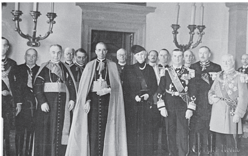
Villa Mazzoleni en 1936. El cardenal Pacelli y el almirante Horthy en la Legación de Hungría ante la Santa Sede.