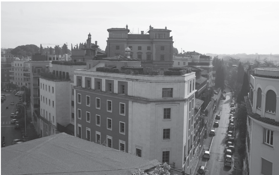
Villa Tevere en la actualidad, desde el lado norte. En primer plano, Uffizi. Por detrás asoma la Villa Vecchia.