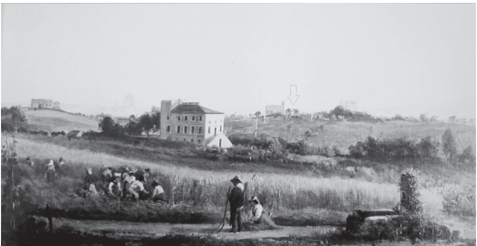
Giacomo Maes: La Vigna Sacchetti (1878). También aquí se señala con una flecha el lugar donde se encuentra Villa Tevere. Si en el grabado de Falda la perspectiva era sur-norte, aquí es sureste-noroeste. En la margen izquierda del cuadro, la Vigna Cartoni, junto a la actual Via De Notaris. Entre el casino de la Vigna Cartoni y el de la Vigna Sacchetti (el edificio principal en el centro del cuadro), Maes ha representado en lontananza, apenas visible, la cúpula de San Pedro. A la derecha, sobre una colina, la Vigna Balestra, y al fondo, también difícilmente reconocible, el Monte Mario.