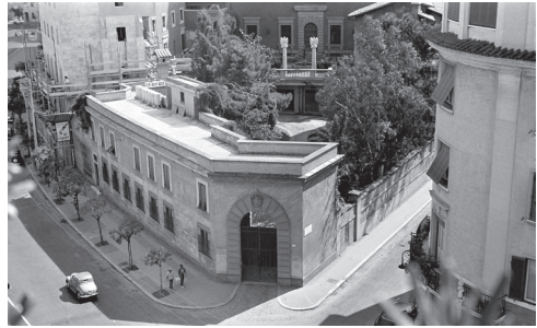
El Pensionato en los años cincuenta.