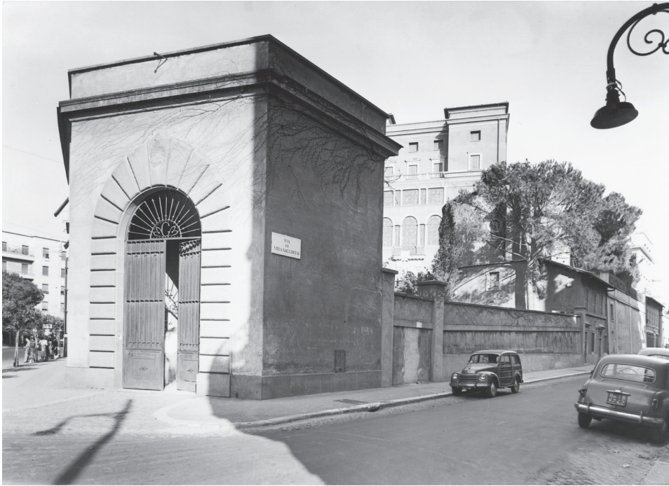
Villa Tevere a mediados de los años cincuenta desde la esquina Bruno Buozzi – Villa Sacchetti.