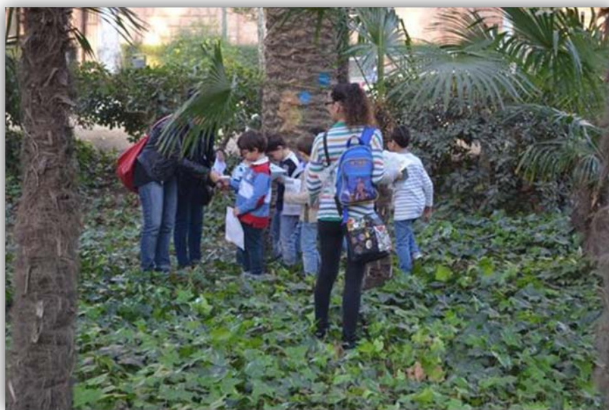
FIGURA 3. Actividad: “Las Palmeras”.

Una vez contrastadas todas estas diferencias se les facilita los sobres que contienen las pistas a seguir para descubrir más información sobre las palmeras. Un miembro del grupo lee la pista en voz alta y cuando deciden a que palmera se refiere la pista y dónde deben buscar, corren hacia el lugar (FIGURA 3). Cuando vuelven con las pistas resueltas se pone todo el material en común y se configura una línea cronológica del ciclo vital de las palmeras.