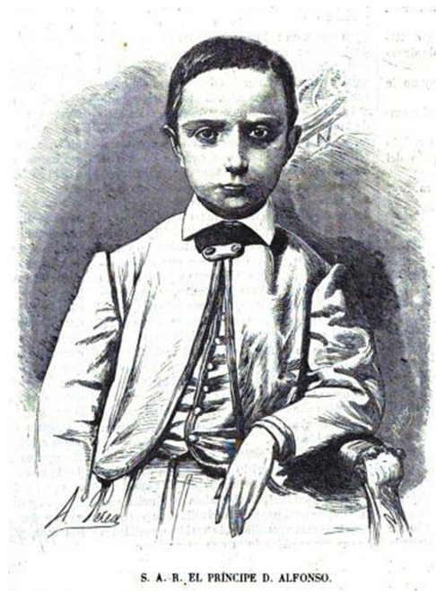
Figura 3. S. A. R. El Príncipe D. Alfonso. Fuente: El Periódico Ilustrado , 1865. Localización: Hemeroteca Municipal de Madrid.

Después de las demandas para establecer un Gimnasio Normal, bajo la protección oficial del Estado, el Conde de Villalobos (1865, p. 233), en la Reseña histórica del Gimnasio Real de Madrid, mencionaba: “En España la instrucción gimnástica pudiera no tener nada que envidiar, pero está en el más lastimoso desorden; todo el que quiere se titula profesor, establece un gimnasio, se utiliza de sus productos, malbarátala salud de los que se ponen en sus manos, y nadie le dice una palabra”.