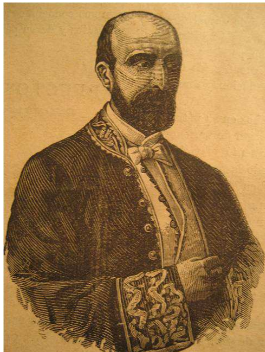
Figura 1. Francisco Aguilera y Becerril, Conde de Villalobos.

Así después de tres décadas y de las frustradas experiencias, que en educación física había protagonizado Francisco Amorós, el reconocido fundador de la educación física en España y Francia (López Tamayo, 1882) llegó el turno a un ilustrado madrileño, el Conde de Villalobos. Este nuevo gimnasiarca, en 1841, trató de recuperar el tiempo perdido restableciendo la segunda institución de la educación física del país, el Instituto Gimnástico de Equitación y Esgrima (Torrebadella, 2013c), una oportunidad que concedía la continuidad hacia la institucionalización de la educación física contemporánea. Sobre esta cuestión se citaba en la prensa de entonces: “Ojala nuestra juventud adquiriera afición á estos egercicios que vigorizan la parte física y proporcionan la destreza y robustez tan apreciables en el hombre [sic.]” ( A. de Y. Z., 1841, p. 102).