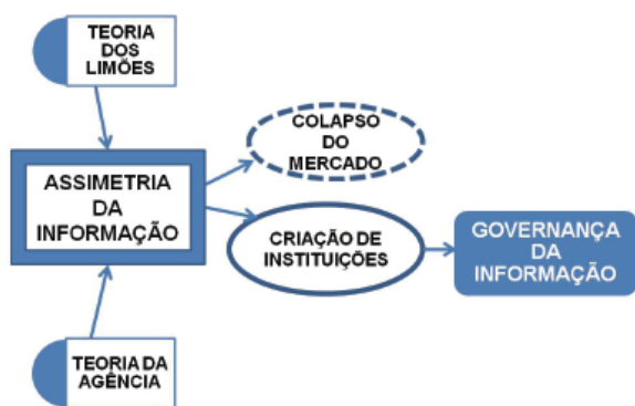
Figura 3. Teorias, consequências e estratégias para minimizar efeitos da assimetria da informação

A figura 3 mostra a relação das teorias econômicas e da administração para o trato, especialmente com a assimetria da informação, e que resultam em sua governança.