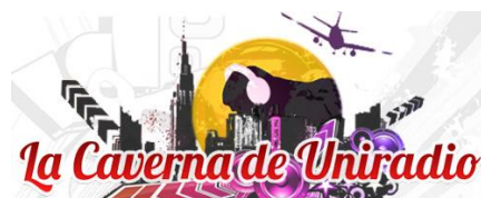
Figura 3. Logo del programa "La caverna" de Uniradio.

Pero no solo de programas se nutre la radio. Las cuñas publicitarias también son fundamentales. En el caso que nos ocupa, el de Uniradio, esta emisora utiliza estos elementos de transición como oportunidad para dar contenido social y educativo a su parrilla.