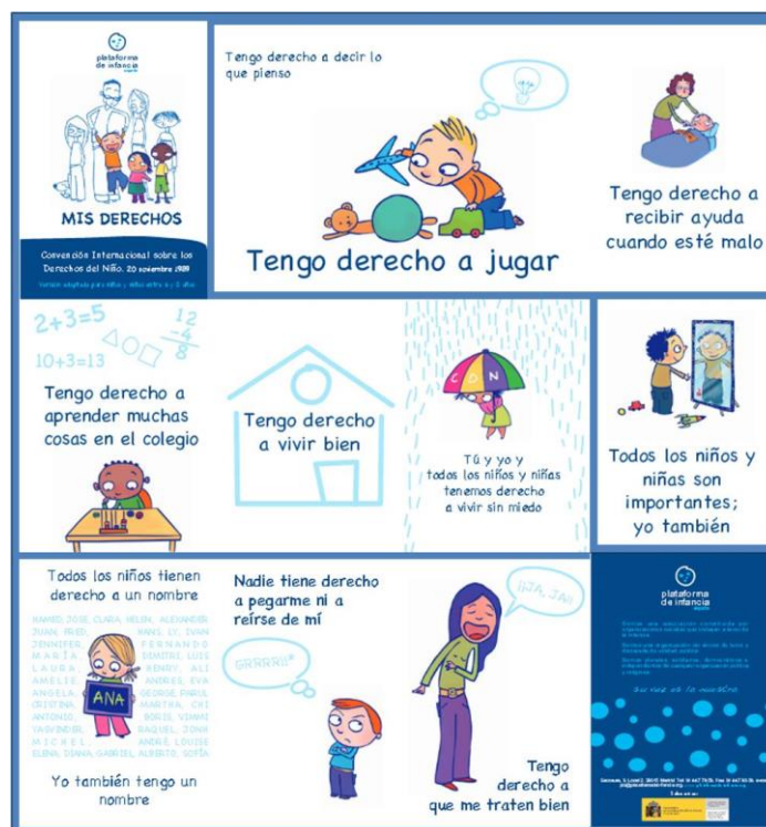
Figura 1. Los Derechos del Niño a partir de: Plataforma de Infancia http://goo.gl/jHg0r3

Fundamental (junto con: la no discriminación, el interés superior del niño, el derecho a la vida, a la supervivencia y al desarrollo) que sustentan los Derechos del Niño (figura 1) aprobados en su Asamblea en 1989.