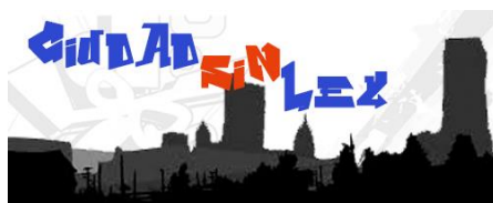
Figura 2. Logo del programa "Ciudad sin ley" de Uniradio.

En la radio de la Universidad de Huelva se han llevado a cabo, desde hace ya varias temporadas, programas elaborados conjuntamente con el equipo de profesores y de orientadores de varios Colegios e Institutos de la provincia, llegándose a incorporar esta actividad dentro del currículum regular de alguna de las asignaturas. En la actualidad por ejemplo, una vez a la semana realizan su programa los menores del Colegio Ciudad de los Niños de Huelva, cuyo título es "Ciudad sin Ley".