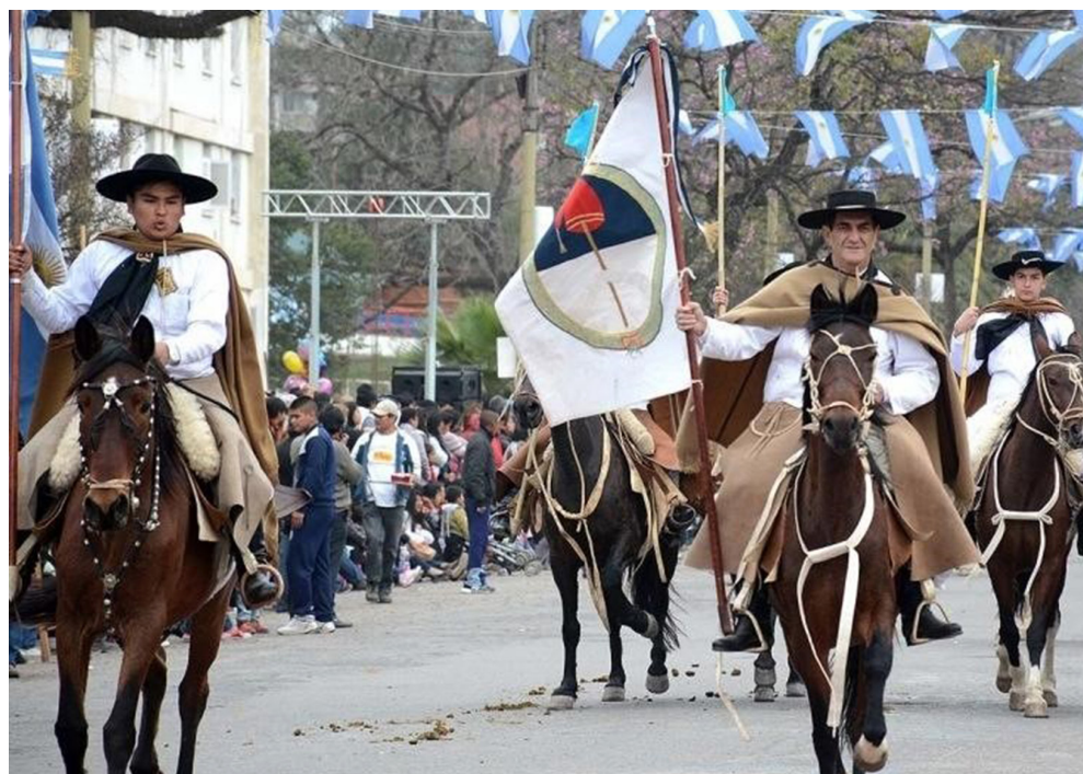
Figura 6: Actos evocativos del Éxodo Jujeño