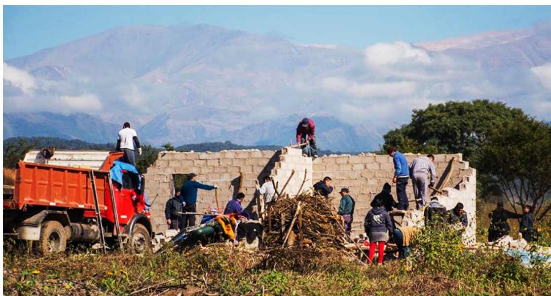
Figura 4: Asentamiento popular desmembrado