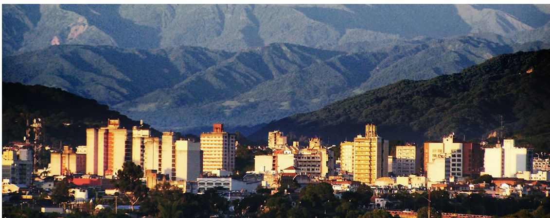
Figura 3: Imagen panorámica de Jujuy