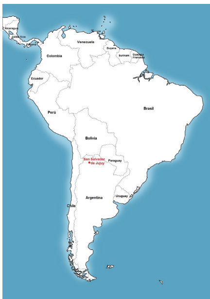
Figura 1: Mapa Sudamérica