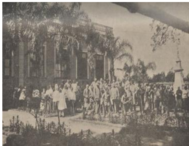
Figura 5: Grupo de recolhidos do Asylo de Mendigos