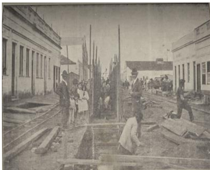
Figura 1: Escoramento para rede de esgoto

A fotografia da Figura 1 refere-se a uma obra sendo executada e nota-se, na cena, algumas pessoas trabalhando e outras tantas observando, evidenciando a notoriedade desta melhoria diante dos olhos da população.