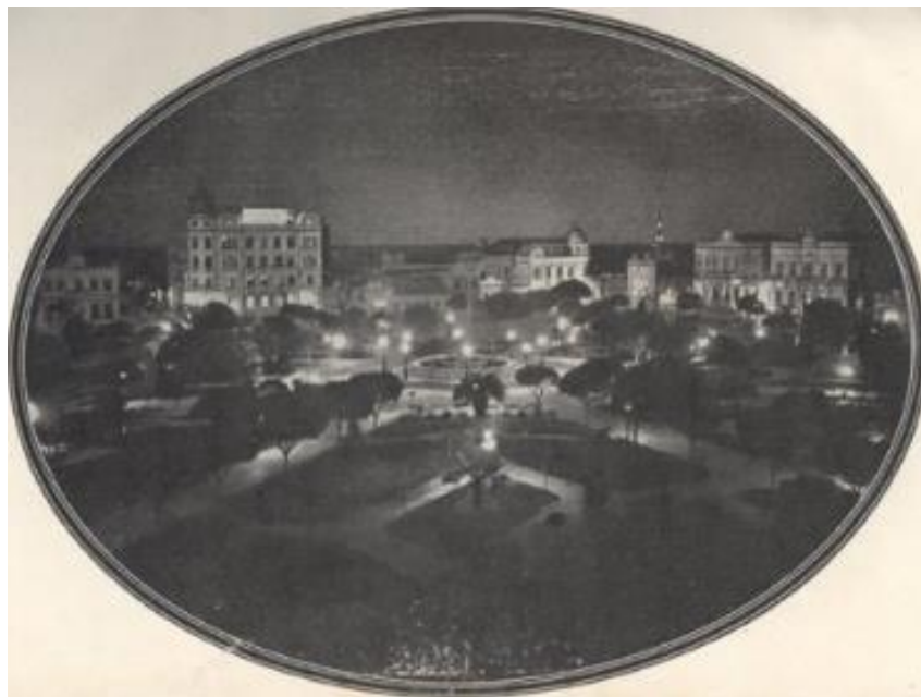
Figura 2: Iluminação na Praça da República

conforme referido na citação acima. Vê-se a praça banhada por luz elétrica, sendo tanto o espaço, quanto a tecnologia que a ilumina artificialmente, conotações da condição moderna.