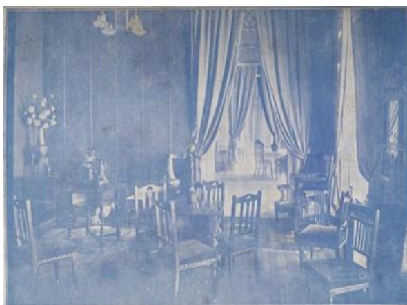
Figura 7: Um dos salões do Club Commercial