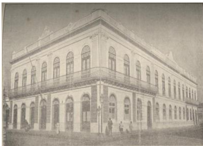
Figura 6: Fachada Club Commercial

destas fotos ocuparam o conteúdo de várias páginas e, também, um texto foi dedicado ao clube (CLUB..., 1920). O artigo destaca a sua fundação, em 1881, a visita da família Imperial em 1887, o número de 550 sócios e as reuniões elegantes e distintas. As fotografias mostram as possibilidades de interação social por ele proporcionadas, com tomadas que evidenciam sua escadaria, seu luxuoso mobiliário e seus amplos salões de bilhar, de leitura, de baile e de jogos, ilustrando-o, como um local de ócio e lazer. Chama a atenção no referido texto o fato de iniciar destacando o uso dos clichês para apresentar as dependências do “sumptuoso palacete” do clube, para que lá fora se tenha conhecimento do requintado gosto estético e cultural da cidade. Daí se supõe que o alcance da publicação dava-se para além dos limites locais, contemplando, deste modo, a busca por mostrar/ostentar a cidade moderna, civilizada, rica e elegante, assim delineada.