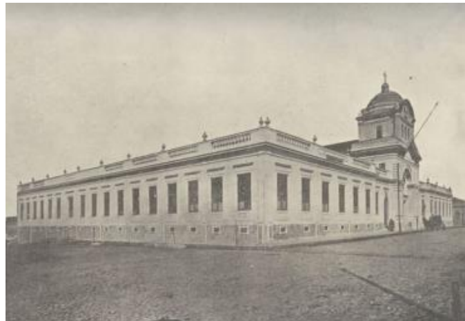
Figura 4: Vista geral do Asylo de Orphãs