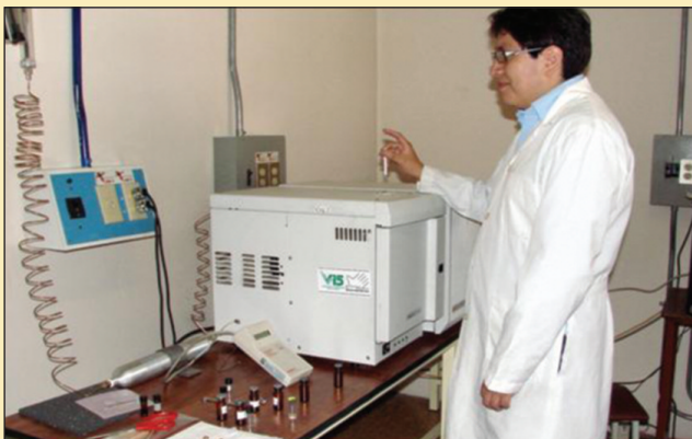
Figura 4. Equipo de gas cromatografía acoplado a masas.

Considerando que la velocidad de flujo que se usa actualmente para las columnas capilares es baja, hace posible que la columna pueda ser conectada directamente a una cámara de ionización de un espectrómetro de masa (que generalmente es un espectrómetro de masas con un analizador cuadrupolar o trampa iónica), es posible acoplar un gas cromatógrafo con un espectrómetro de masas en modo de obtener, y conservar en memoria, el espectro de masas de los componentes del aceite esencial. La sucesiva comparación del espectro de masas obtenido por un compuesto eluido en determinado momento del análisis cromatográfico, es al que puede ser atribuido un propio "Índice de Kováts", con espectros de referimiento contenidos en apropiadas librerías insertadas en el programa GC/MS, que consienten la atribución de la estructura completa al compuesto. Algunas veces tal atribución es facilitada de la comparación en el espectro de masas de algunos picos en zonas características del espectro que permiten al menos señalar la pertenencia de la estructura en examen a una determinada clase de compuestos. Es este el caso de la fragmentación de los sesquiterpenos tipo farne-seno, elemeno, cariofileno. Otra característica es la