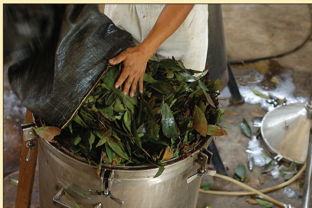
Figura 1. Destilador que emplea el sistema de destilación con agua y vapor de agua.

más oscuro y una calidad inferior en relación con los aceites obtenidos utilizando otros procesos. Algunos componentes de los aceites esenciales, como los ésteres, pueden sufrir hidrólisis, mientras otros (aldehídos y los hidrocarburos monoterpénicos acíclicos) pueden sufrir polimerizaciones. Los componentes oxigenados, como los fenoles, pueden ser disueltos y no son removidos completamente por destilación. Algunos equipos permiten el retorno del agua condensada, minimizando de esta manera el riesgo de la falta de agua en el proceso. La única ventaja de este proceso es el bajo costo del equipo y la posibilidad de que sea realizado en áreas rurales, usando leña como combustible, cuando otras fuentes no están disponibles.