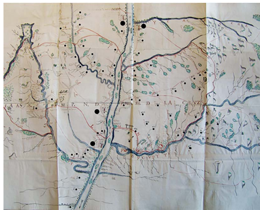
Figura 2 – Detalhe do mapa produzido pelo cabildo de La Cruz, em 1784. Localizado no Archivo General de la Nación, em Buenos Aires. Sala IX, 22-8-2