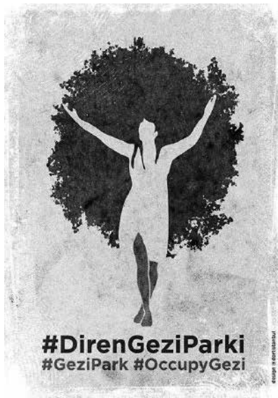
Figura 4: Poster Diren Gize Parki.