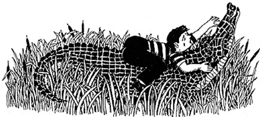
Figura 2. Carballido, E. (1991) La historia de Sputnik y David . Ilustración de María Figueroa.

En este cuento en particular están presentes temáticas que en los anteriores no se habían tratado. Llama la atención el hecho de que se hiciera una crítica social en la que se referencia la problemática de los trabajadores ferrocarrileros, está explícito el tema de la huelga y la organización obrera por la lucha de los derechos de los trabajadores. El papá del protagonista y sus compañeros hacen