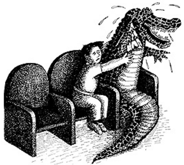
Figura 1. Carballido, E. (1991) La historia de Sputnik y David . Ilustración de María Figueroa.

Los elementos más relevantes en este cuento son presentados al final, pues a lo largo de la historia es difícil imaginar que David y su amigo, quien lo había acompañado desde pequeño podía separarse de él y conformar un nuevo hogar, como sucede al concluir el relato. Este inesperado desenlace abre las puertas a diversas interpretaciones y distintas lecturas, fomenta la creatividad, la imaginación y la capacidad crítica de los niños.