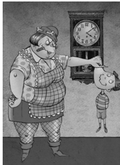
Figura 3. Hinojosa, F. (1992). La peor señora del mundo . Ilustración de Rafael Barajas.

Una de sus obras más famosas, y primeras, es A golpe de calcetín (2000), la historia de un pequeño que debe vender periódicos para solventar las necesidades de su familia y cómo el destino y un juego de circunstancias lo llevan a convertirse en una persona exitosa.