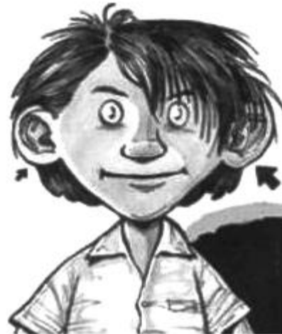
Figura 4. Hinojosa, F. (2001). Las orejas de Urbano . México: Alfaguara. Ilustración de Rafael Barajas.

“Los niños de hoy toman en cuenta el que se les trate con respeto, antes pensábamos que los pequeños eran capaces solo de leer cuentos de hadas, princesas, castillos, duendes y hoy, pueden leer cualquier tema” (Hinojosa, 2005b).