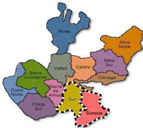
Figura 1. Regiones de estudio, zona sur y sureste del Estado de Jalisco que están marcadas en líneas punteadas.

promedio, que se obtuvo de todas las colonias que participaron en la prueba (menos de 100 agujiones).