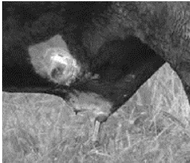
Figura 6. Cirugía terminada con colocación del dren y sutura con puntos en "U".