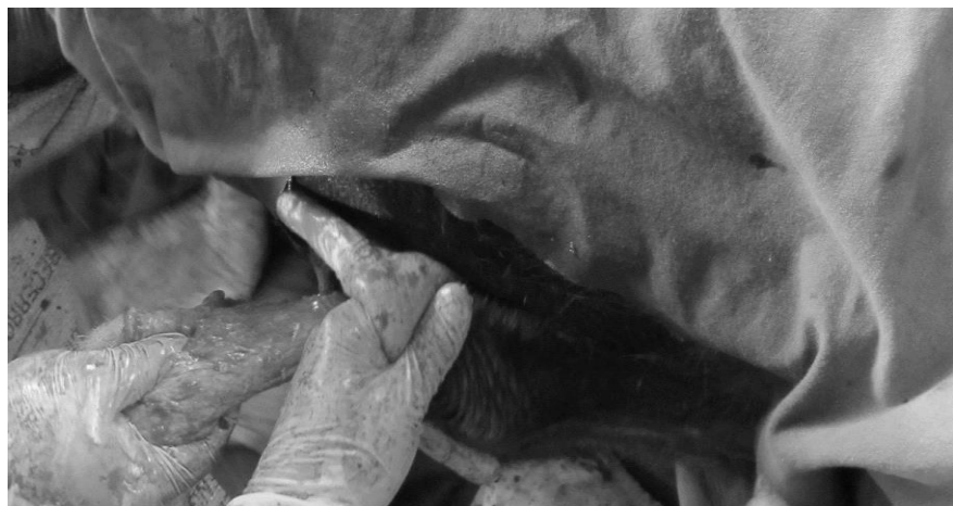
Figura 3. Desbridación y disección del forro en 2/3 de su longitud.

Posteriormente se procedió a desbridar el plano subcutáneo, utilizando tijeras de punta roma en dirección oblicua, esto es en el ángulo aproximado de desviación ( 45^{\circ} ); una vez desbridado, se deslizó el forro junto con la porción cutánea del prepucio, cuidando que no existieran torsiones (Figura 4).