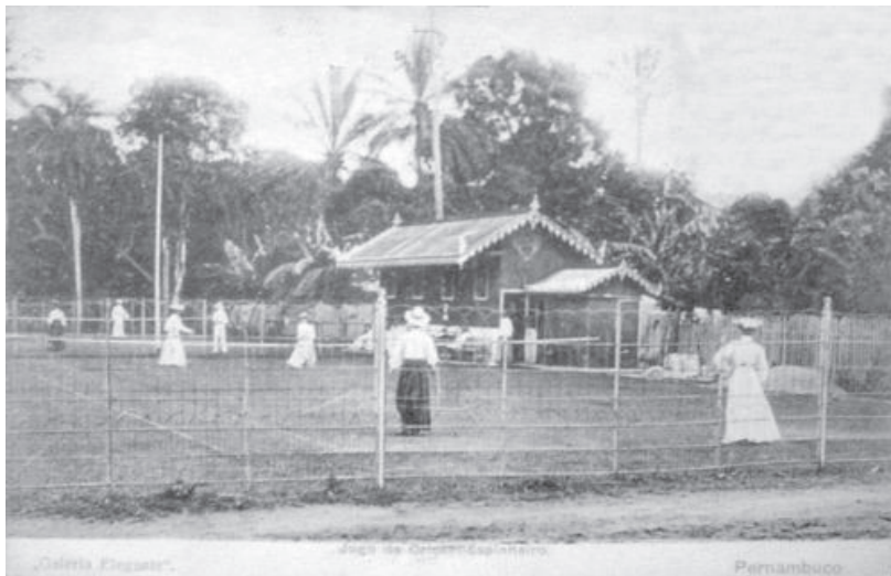
Mulheres jogando críquete no British Club

Em Recife, tal influência continuou a ser sentida nas primeiras décadas do século XX. Em 1906, houve uma aproximação entre o Pernambuco Cricket Club e o British Club 73 . A princípio, o segundo cedeu suas instalações para as assembleias e algumas reuniões sociais do primeiro. Em 1907, a agremiação de críquete passou também a promover seus jogos na sede do bairro da Torre, decisão por alguns celebrada como uma possibilidade de ter uma experiência mais exclusiva. Já outros sócios se mostraram contrários, defendendo com fervor a manutenção das antigas tradições 74 . Aparentemente, de qualquer maneira, todos gostaram das novas instalações, por sua beleza e conforto.