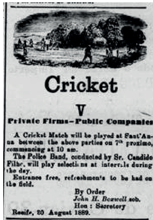
Anúncio de jogos de críquete entre equipes de empresas britânicas Jornal de Recife, 31 ago. 1889, p. 3

A intencionalidade de celebração de traços culturais do Reino Unido pode ser percebida em outras ocasiões. No mesmo ano de 1887, houve um desafio entre britânicos empregados no comércio e nas companhias públicas. A crer no cronista, a festa foi “concorrida por grande número de famílias e cavalheiros” 51 . Essa partida se repetiu por longo tempo, sempre atraindo muitos interessados da colônia e mesmo alguns brasileiros e estrangeiros de outras nacionalidades.