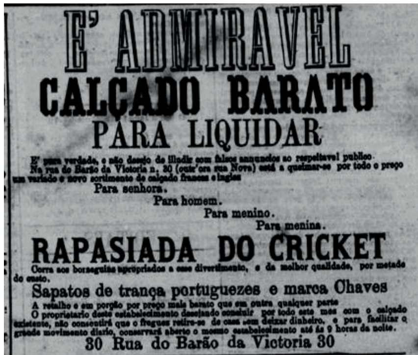
Anúncio de loja de sapatos oferecendo calçados adequados para a prática do críquete Jornal do Recife, 24 mai. 1871, p. 4.

Interessante saber que para alguns jogos passaram a ser previstos bondes extras para atender o público, um sinal de que aumentara o número de interessados 29 . Outro indício de que se dedicava um pouco mais de atenção à modalidade foi o fato de uma loja de calçados oferecer para a “rapaziada do críquete (...) borzequins apropriados a esse divertimento” 30 .