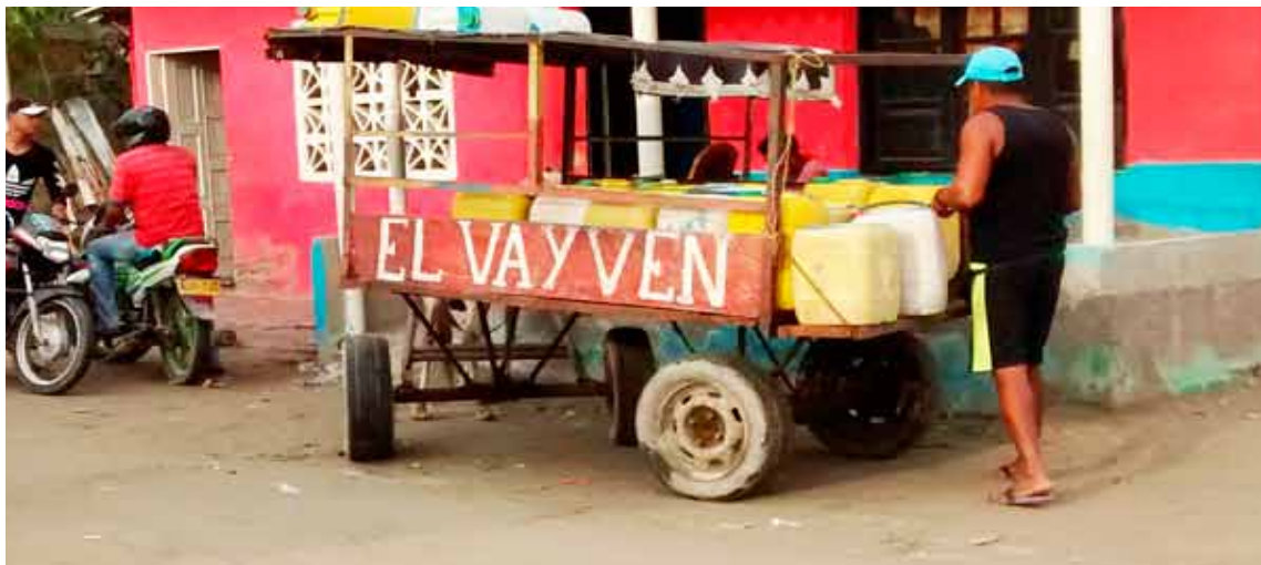
Figura 12. El Regreso del Aguatero, periquillo de Pueblo Viejo, 2016