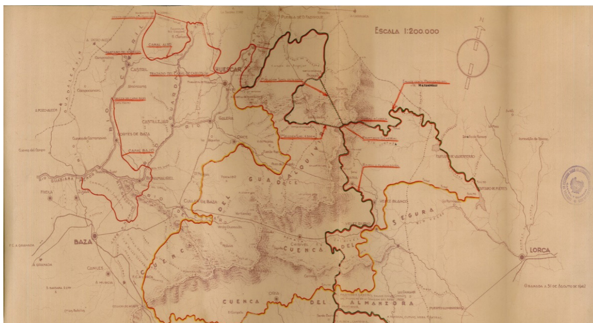
Imagen 3. Canales proyectados por la Comisión del Dictamen 1942