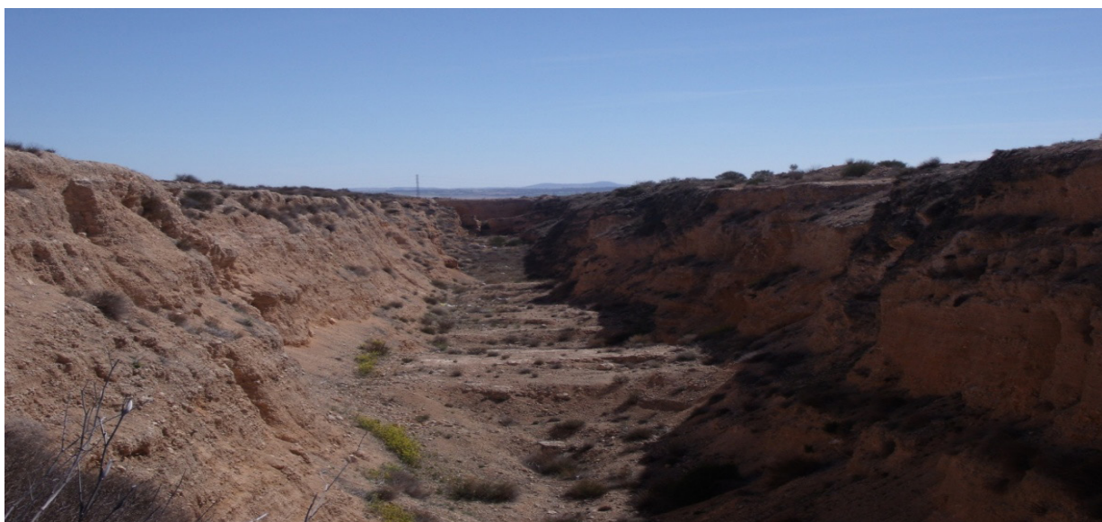
Imagen 2. Restos de la excavación del canal de Murcia entre Huéscar y Puebla de Don Fabrique