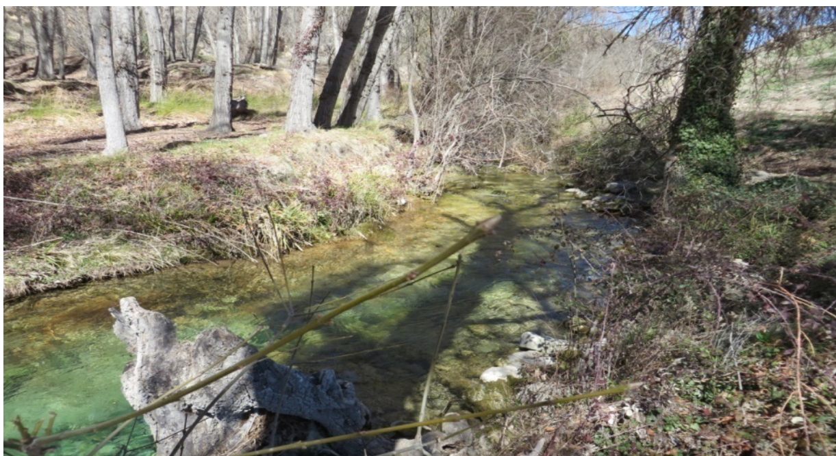
Imagen 1. Fuentes del río Guardal (Huéscar-Granada)