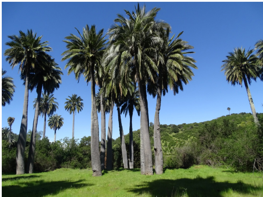
Imagen 4: Palma chilena en matorral esclerófilo abierto; Candelaria.

tos de Candelaria, siendo en esta última en donde la estructura es más diversa y las coberturas muestran un mayor poder de influir sobre los distintos factores del medio. Estas puntuaciones pueden ser comparadas con aquellas de las colinas de Viña del Mar donde la media de valoración para este grupo de sub-criterios alcanzó los 50 puntos, siendo muy similar a las puntuaciones de Candelaria. (Imagen 4).