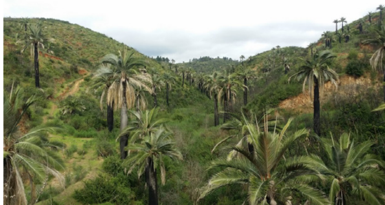
Imagen 3: Bosque de palmas en la microcuenca de El Quiteño. Viña del Mar