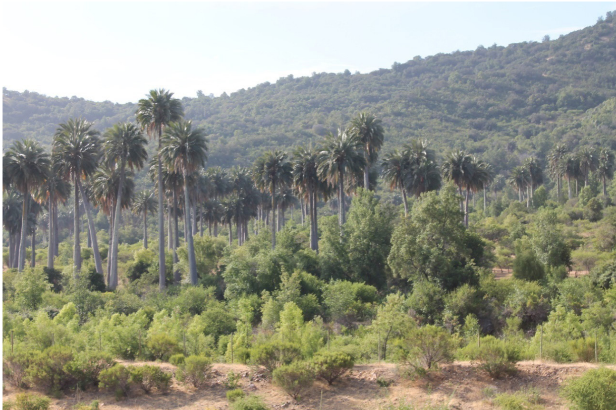
Imagen 2: Palmas chilenas asociadas a matorral esclerófilo en el sector de Botalcura.

Tal y como puede apreciarse, el cortejo de especies asociadas al bosque mediterráneo con palmas del sector de Botalcura es considerablemente más reducido que el de Candelaria (Imagen 2). En las siguientes líneas y tablas se desarrollan los aspectos relacionados con la evaluación biogeográfica. En la tabla 3 se pueden observar las diferentes valoraciones.