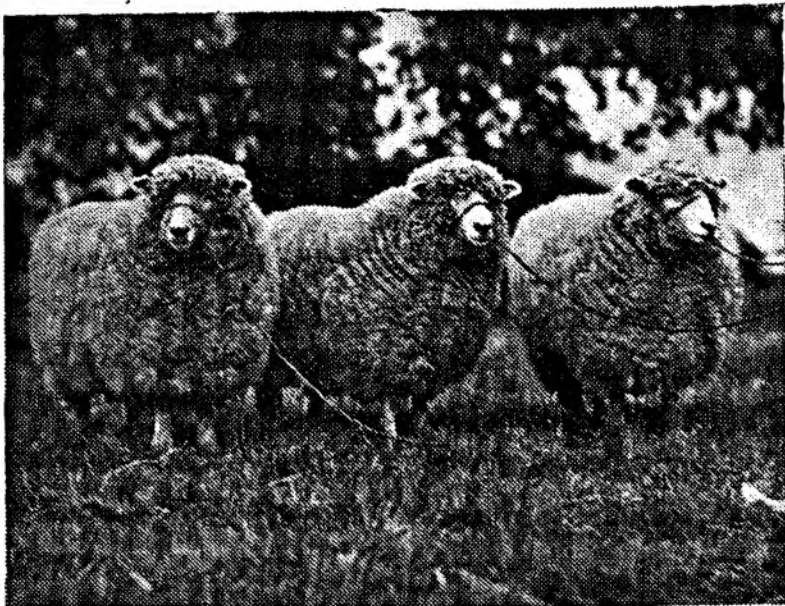
Raza "Romney Marsh". Origen: Inglaterra. Objeto: Carne y lana. Producción lana: 3\frac{1}{2} a 5\frac{1}{2} kilos por esquila. Peso vivo: Machos hasta 275 libras. Hembras: hasta 250.