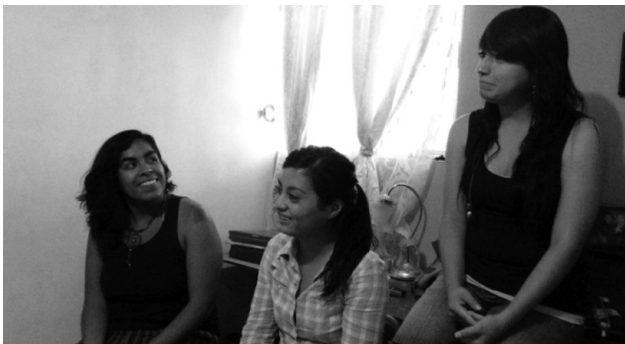
Imagen 1. Integrantes Batallones Femeninos