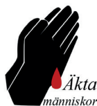
Figura 3. Imagen aparecida en la primera temporada de la serie Real Humans (2012) que identifica al “Frente de Liberación de Auténticos Humanos”.

De las jerarquías clásicas, la única que se mantiene como inmutable en la serie es la sexo genérica. Tanto las hubots mujeres y las mujeres humanas, como los hubots hombres y los hombres humanos, responden a roles, prejuicios y estereotipos asignados tradicionalmente. Como se señala en el artículo Simulaciones sexo genéricas, bebés reborn y muñecas eróticas hiperrealistas , hasta el momento, “el proceso de tecnificación de las vidas y de los cuerpos no ha logrado superar las divisiones binarias, las visiones androcéntricas y la lógica tradicional patriarcal, a pesar de las innovadoras teorías de Firestone y Haraway” (Tajahuerce & Mateos, 2016, p. 210).