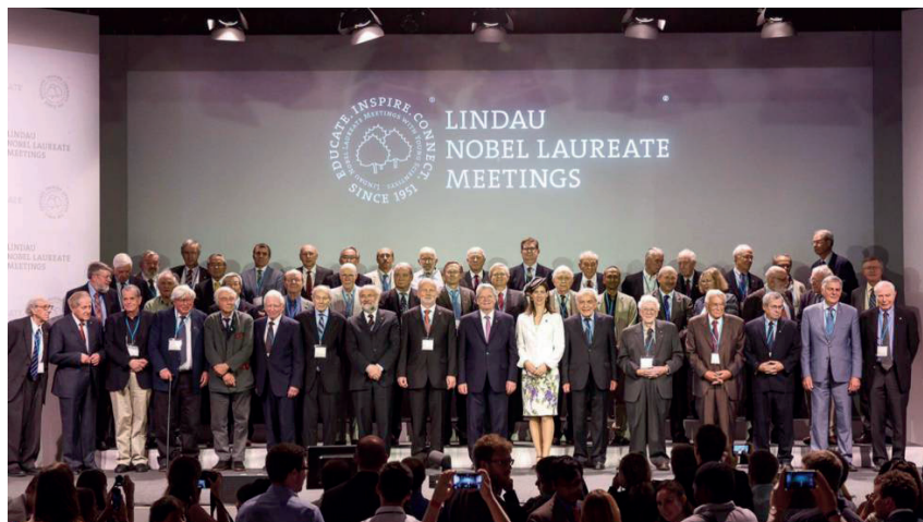
Figura 2. Reunión de premios Nobel en Lindau (Suiza) en 2015. La mujer que aparece no es científica, es una condesa según informa el diario.