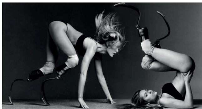
Figura 1. De la izquierda a derecha, imagen de la atleta y modelo Aimee Mullins y del científico Hugh Herr.

En las noticias recientes sobre tecnología en medios digitales de diversos países, se observan sesgos de género y reproducción de un sistema androcéntrico y desigual. En algunos medios españoles de amplia difusión sorprenden las imágenes sexualizadas que acompañan a la noticia. Es especialmente significativa la fotografía que se incluye en el artículo titulado “Retos de un futuro posthumano” (Cortina & Serra, 2016) con una imagen sexualizada de la atleta y modelo Aimee Mullins, muy distinta de la publicada por el mismo periódico mostrando al científico Hugh Herr con sus piernas biónicas (Snyder, 2016).