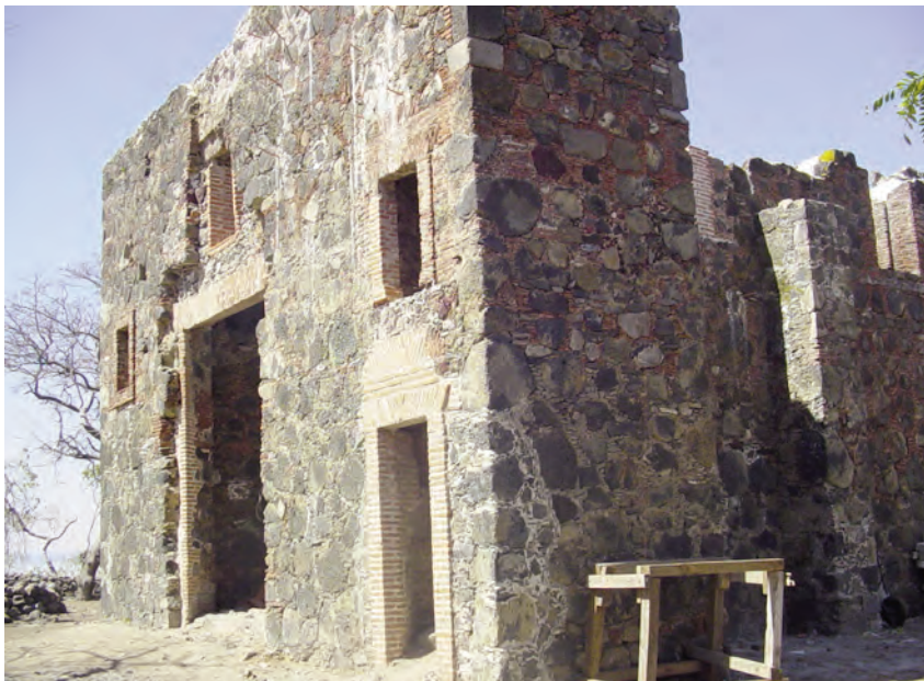
Figura IV. Restos de una de las antiguas capillas en la Isla de Mezcala.

mación, y cuando las autoridades han ido a informar a Mezcala, les han exigido que la reunión se hiciera en el Comisariado de Bienes Comunales. Así, a lo largo de 2008 y 2009, sus quejas han aparecido periódicamente en la prensa de Guadalajara, logrando el apoyo de diversos sectores locales y regionales.