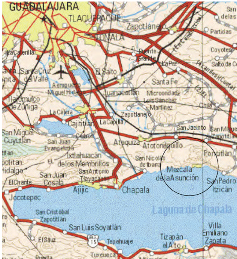
Figura 1. Ubicación de la comunidad de Mezcala en el Estado de Jalisco, junto al lago de Chapala

de la comunidad de estudio; el segundo, es apuntar el argumento que va a guiar las siguientes páginas, es decir, la diferencia entre el acontecimiento local y su lectura, y el nacional y su uso.