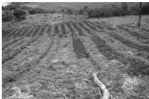
Figura 3. Áreas de actividad agropecuaria.

Reconocer los contextos históricos de manejo del poder y decisión para el uso y apropiación de los recursos naturales de las sociedades, puede ser útil en la generación de alternativas de fortalecimiento de los procesos de construcción cultural en torno a la gestión integral del ambiente, por lo que es necesario redireccionar los fines particulares del desarrollo centrados en el crecimiento económico hacia la construcción colectiva de una “sostenibilidad fuerte”.