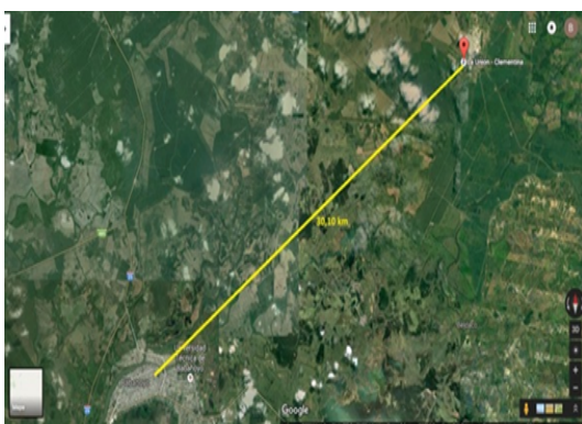
Figura 9. Distancia de Edificio Matriz a Biblioteca Virtual de Parroquia La Unión (30,10km).