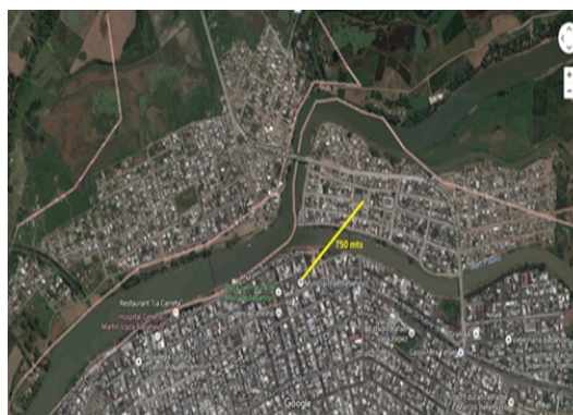
Figura 5. Distancia de Edificio Matriz a Biblioteca Virtual de Parroquia Barreiro (750mts).