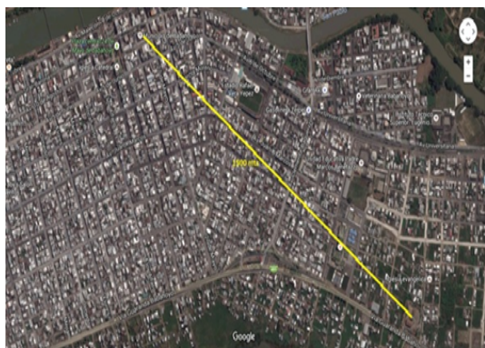
Figura 3. Distancia de Edificio Matriz a Campamento Municipal (1500mts).