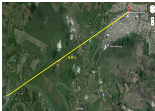
Figura 6. Distancia de Edificio Matriz a Biblioteca Virtual de Parroquia Pimocha (12,45km).