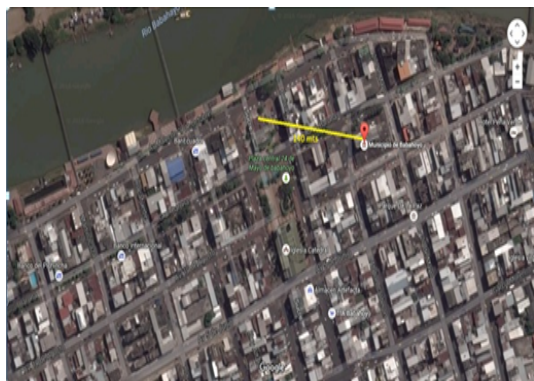
Figura 2. Distancia de Edificio Matriz a Dpto. Cultura y Bodega (140mts).