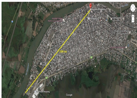
Figura 4. Distancia de Edificio Matriz a Camal Municipal (2100mts).