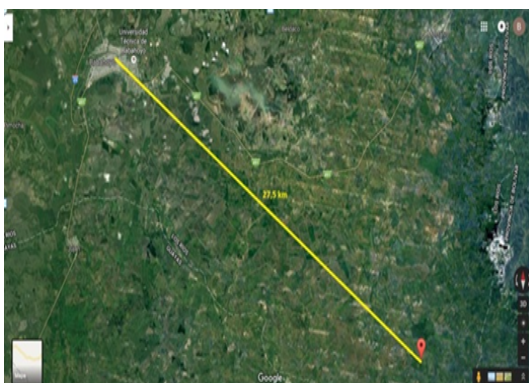
Figura 8. Distancia de Edificio Matriz a Biblioteca Virtual de Parroquia Febres Cordero (27,5km).