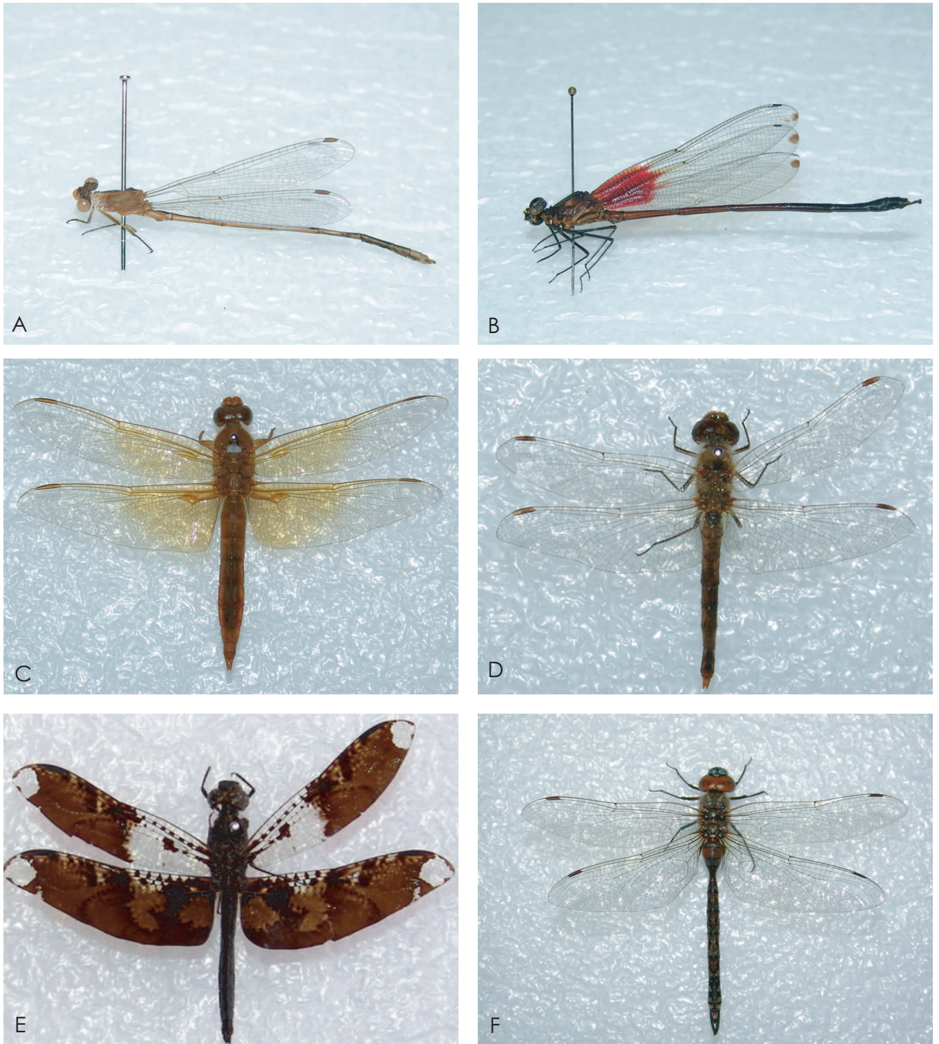
Figura 2. Odonatos de Guanajuato, Jalisco y San Luis Potosí. A. Lestes alacer (Jalisco), B. Hetaerina occisa (San Luis Potosí), C. Libellula saturata (Jalisco), D. Sympetrum corruptum (Guanajuato), E. Pseudoleon superbus (San Luis Potosí) y F. Rhionaeschna multicolor (Jalisco).